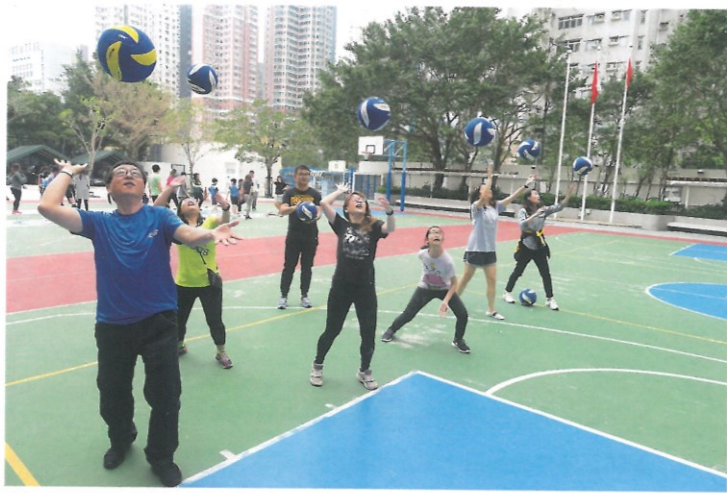
參加「動感親子運動日營」時，家長都相當投入。