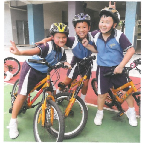
學校特設單車興趣班。

學校近年致力推廣單車運動，自2017年起舉辦不少單車交流活動及比賽，本年度更聯同多所友校聯合主辦「2019-2020年度單車同樂日暨小學生單車繞圈賽」的大型單車活動，並得到和富社會企業、POLAR香港、創意運動協會及何兆麟單車學校的全力支持。當日活動主要分為同樂日及單車比賽，同樂日活動包括騎單車的基本技術指導、道路安全練訓等；比賽則有團體性質的「繞圈賽」及個人計時的「齊出發」。除各組別的個人及團體獎項外，各參賽學校更可角逐6項大獎。另外，學校還推出「親子單車樂」計劃，家長只需參加單車安全講座，以及成功通過基本單車技能評估，便可獲單車使用證及憑證免費借用單車。