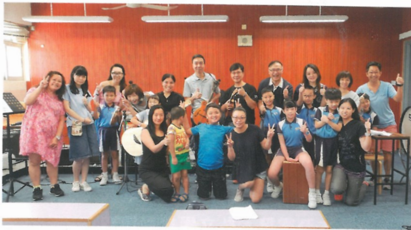
「明日家居」創新科技挑戰賽，於賽前為學生提供不同的工作坊。