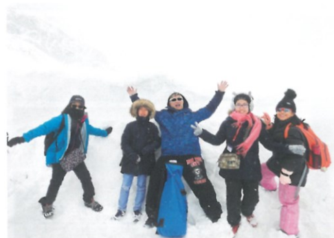
老師帶領學生到世界各地考察環保，讓他們了解氣候變化課題。

每年，學校會舉行為期5天的「體驗式學習周」，讓學生「從做中學」，由直接體驗與實作中學習、觀察、反省、總結及領會，從而發展出學生的學習能力，並感受學習的樂趣，鞏固所學。過程中，學生需要與同學協作討論、反覆嘗試、檢討反思、修正及重組，透過他們之間的協作互動及彼此學習，令學生學習多樣性，亦得以互相照顧。學習周為期5天，學生以混合能力形式組合進行活動。以與課程相關的主題，設計配合學生程度的學習活動內容，包括專家講座、街頭訪問、中國民間藝術製作、編程體驗等，學生可透過探索、體驗活