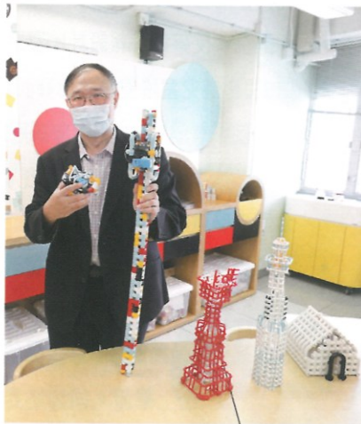
學校利用Tublock進行STEAM教學，供學生自由發揮。

校方會藉着活動和比賽過程中的艱辛和困難，培育學生的堅毅意志和勇於創新的精神。學校每年都會邀請精英運動員到學校作生命分享，例如曾獲多項香港游泳紀錄保持者的施幸余，他們會分享自己如何迎難而上追求理想，故事讓學生明白成長的路途絕不平坦，需要保持樂觀及積極的心境去面對一切挑戰。