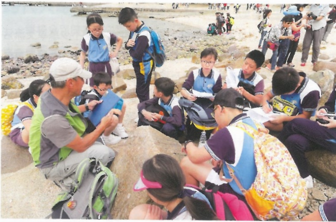
學校發掘不少外界資源，以豐富學生的學習體驗。