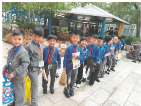
自然教育中心為學生帶來不少與大自然有關的知識。