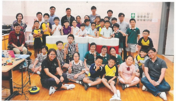
學校舉辦不同的民歌活動，提升學生對學習英文的興趣。