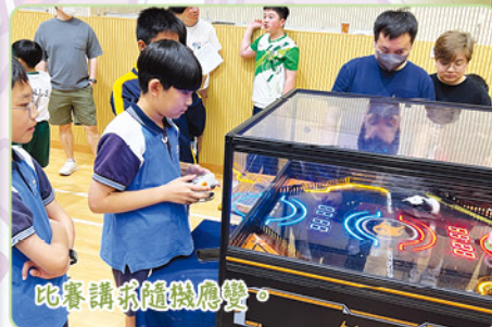
比賽講求隨機應變。