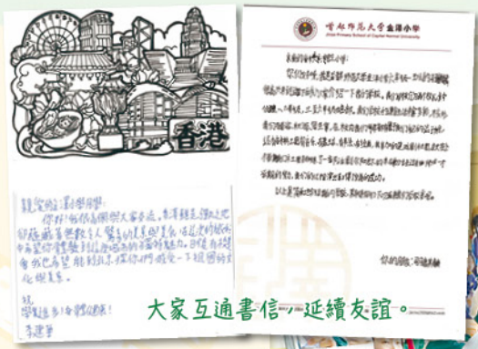
大家互通書信，延續友誼。