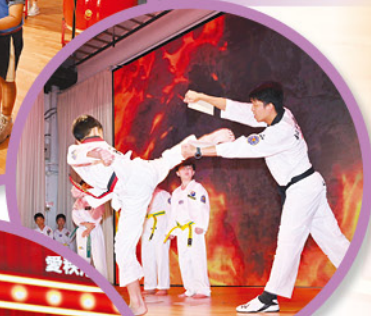
跆拳道班學員耍套拳，腳踢板。