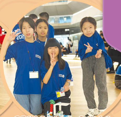
同學與參賽作品合照，展現出自信的笑容與紮實的工程基礎。