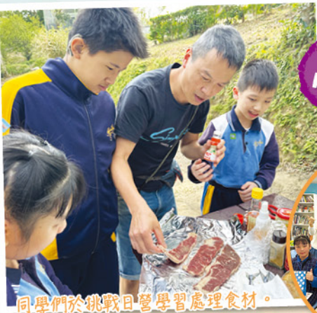
同學們於挑戰日營學習處理食材。