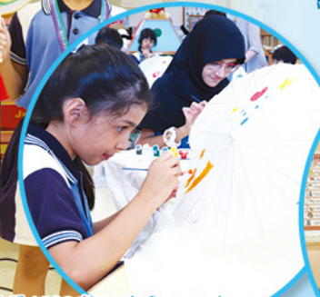
同學們認真地繪畫油紙傘。