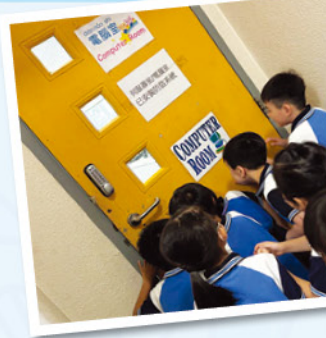
高年級同學在電腦室上課，我們在門外乖乖看看好了！