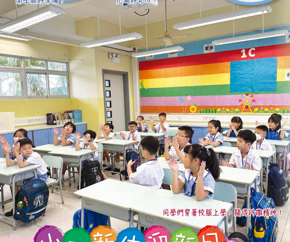
同學們穿著校服上學，顯得抖擻精神！