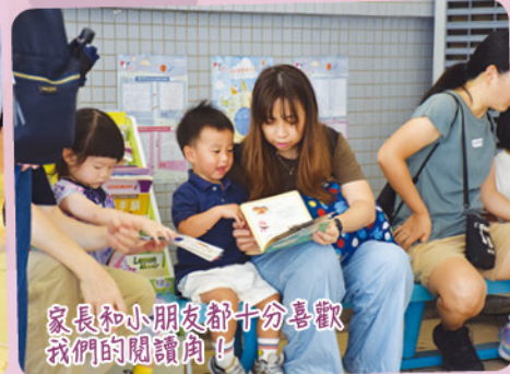
家長和小朋友都十分喜歡我們的閱讀角！