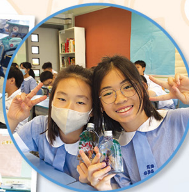
大家製作的浮游花都十分漂亮！