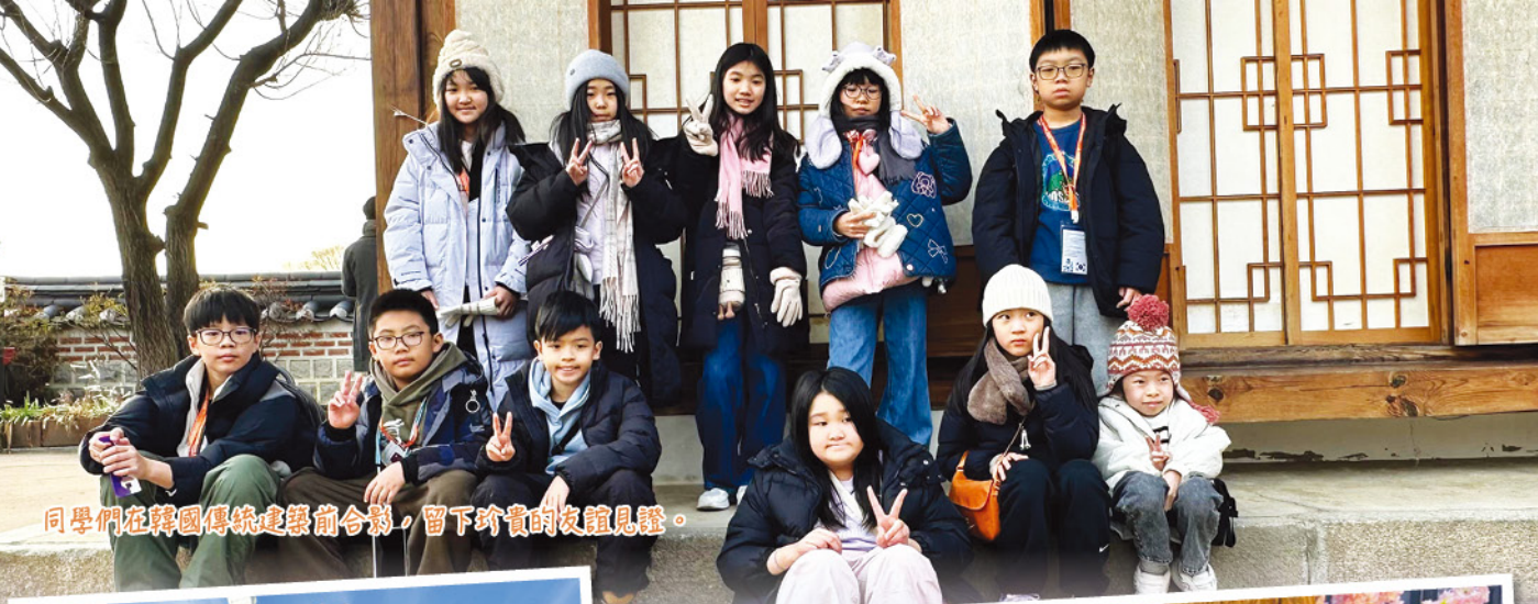
同學們在韓國傳統建築前合影，留下珍貴的友誼見證。