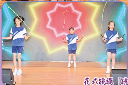
花式跳繩「跳」出真的我。