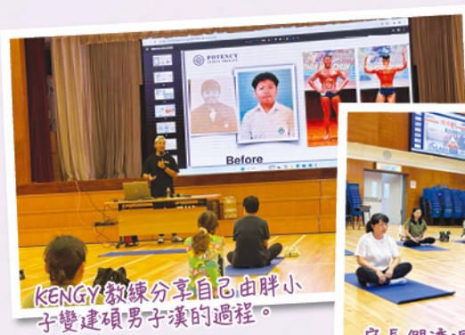
KENGY教練分享自己由胖小子變建碩男子漢的過程。

本校邀請運動伸展治療教練Kengy先生舉辦四節運動減壓課程，讓家長學會正確的拉筋方法，並紓緩痛症。