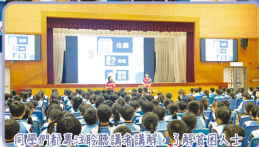
同學們都專注聆聽講者講解，了解貧困人士的生活。