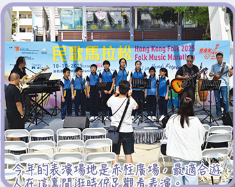
今年的表演場地是赤柱廣場，最適合遊人在這裏閒逛時停足觀看表演。