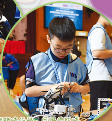
有兩個臨時任務，同學需即時改裝機械車。