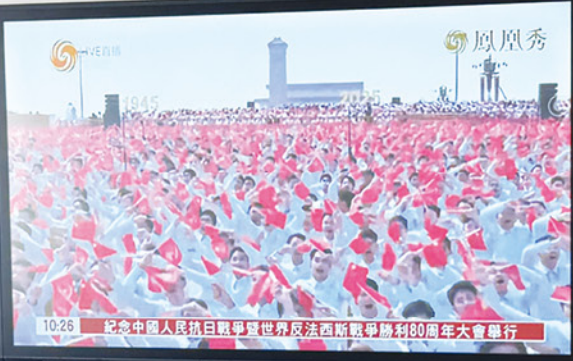
閱兵儀式展現了中國的國力與維護和平的決心，亦帶出國家強調銘記歷史、珍視和平的訊息。