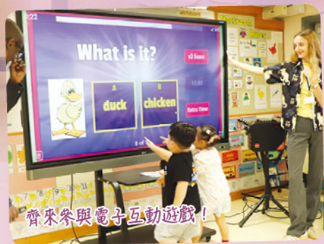
齊來參與電子互動遊戲！