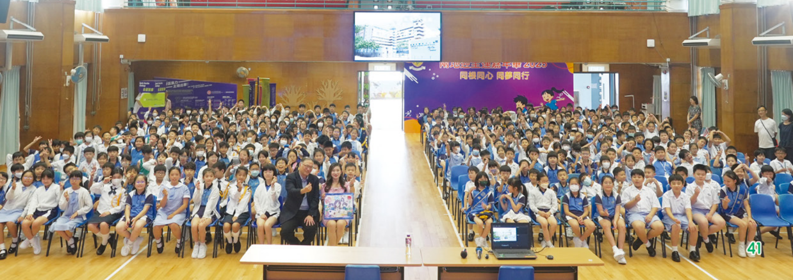
在分享會的尾聲，大家一起拍攝大合照，同學們都獲益良多！