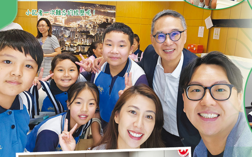
小记者一次難忘的經歷呢！