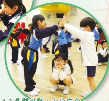
P.1,2 集體遊戲：十分安全。

秋高氣爽的十一月天，一年一度的小學旅行再次在風景優美的烏溪沙青年新村順利舉行。一至六年級的全體學生懷著興奮的心情，一同投入這個充滿歡樂的活動日。