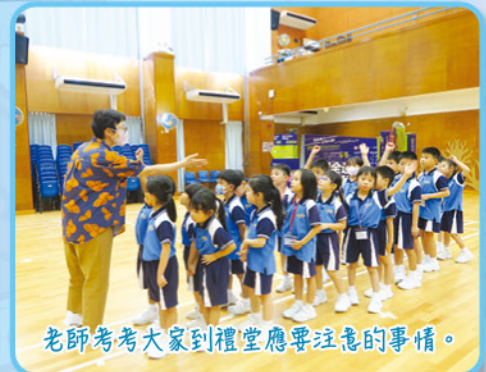
老師考考大家到禮堂應要注意的事情。