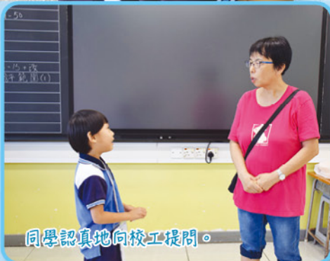
同學認真地向校工提問。