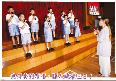
無伴奏的演唱，讓人繞樑三日!