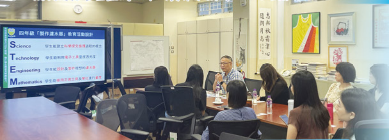
校長為慈善基金的工作人員介本校的STEM 活動。

十月二十日(星期一)，香港賽馬會慈善事務隊伍到訪，了解愛官的STEM 教育發展概況及展望，還參觀了Maker Room 及STEM Room，彼此交流相關心得。