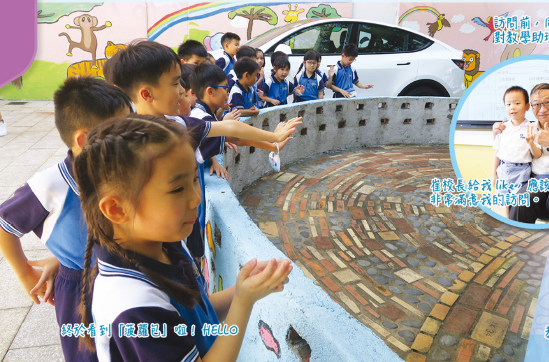
終於看到「菠蘿包」啦！Hello