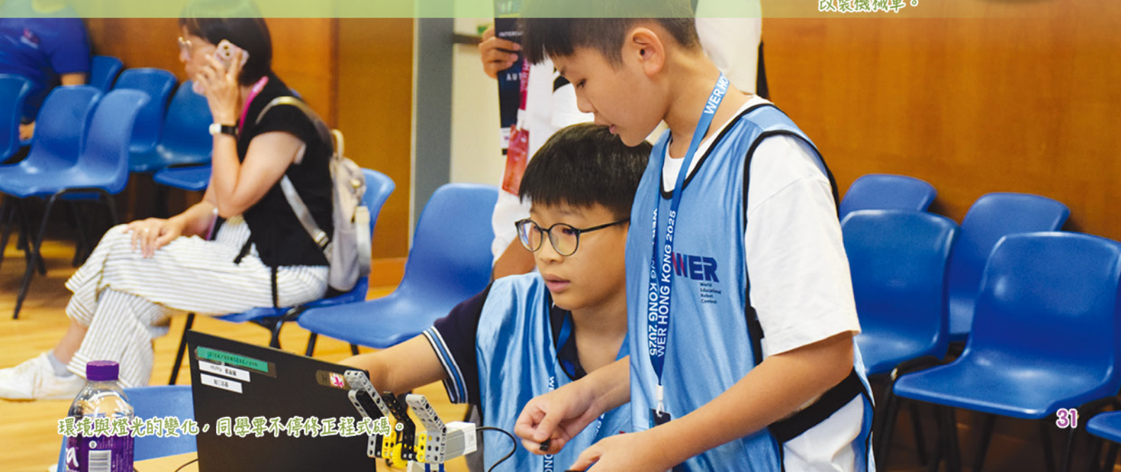
環境與燈光的变化，同學要不停修正程式碼。