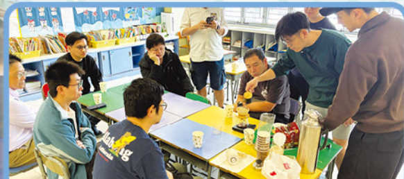
除講座外，亦定期舉辦興趣小組，讓爸爸一起放鬆一下！