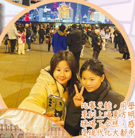
比賽之餘，同學來到上海東方明珠塔下合照，感受現代化大都市的夜景魅力。