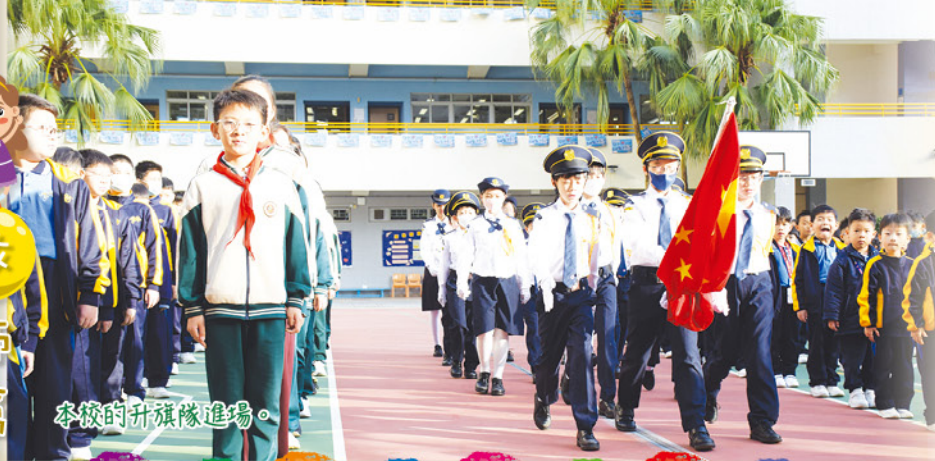
本校的升旗隊進場。