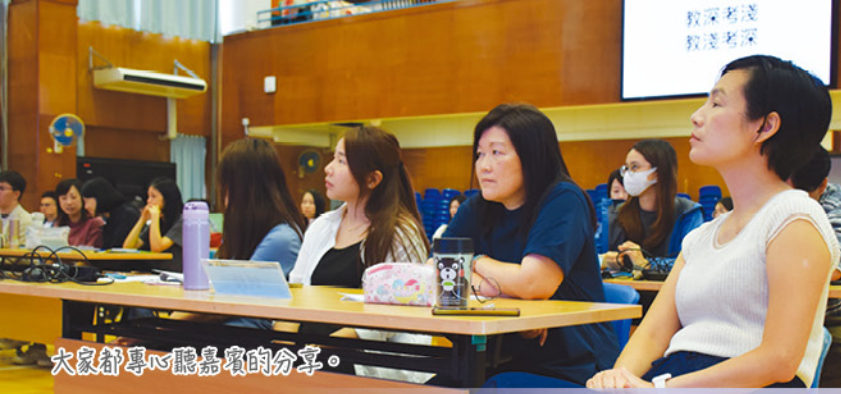
大家都專心聽嘉賓的分享。