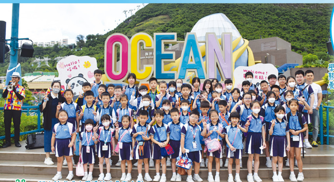
38 師生於海洋公園標誌性景點合影。