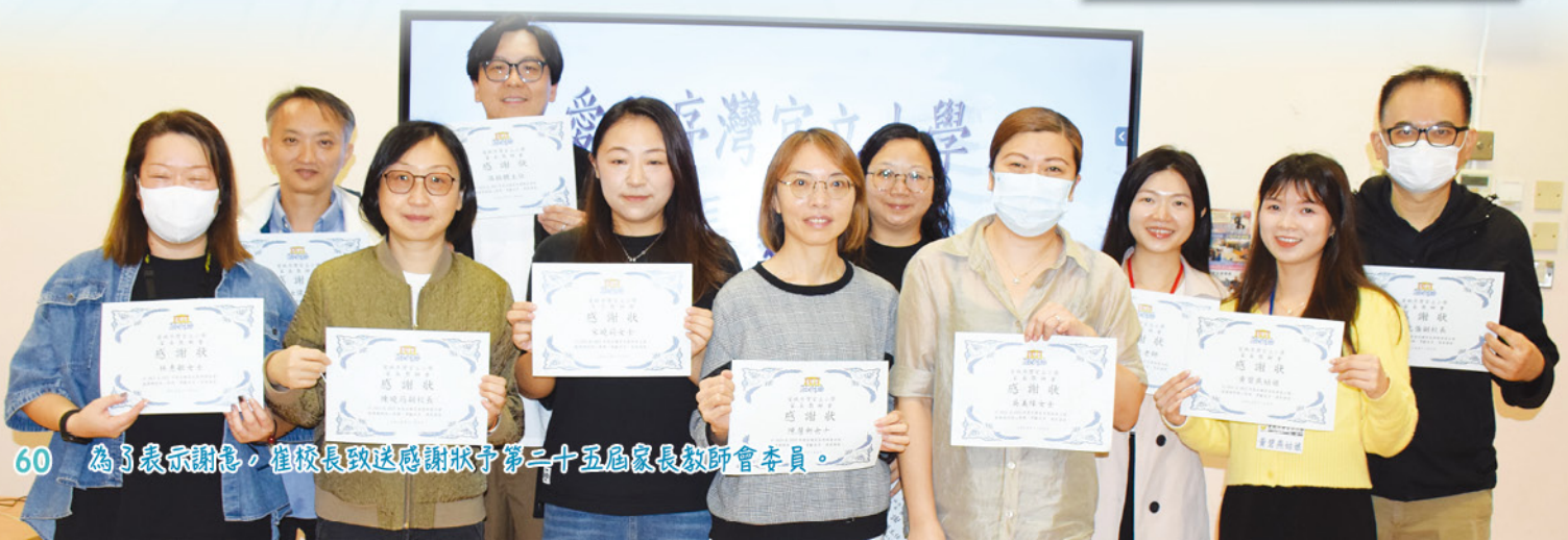
60 為了表示謝意，崔校長致送感謝狀予第三十五屆家長教師會委員。