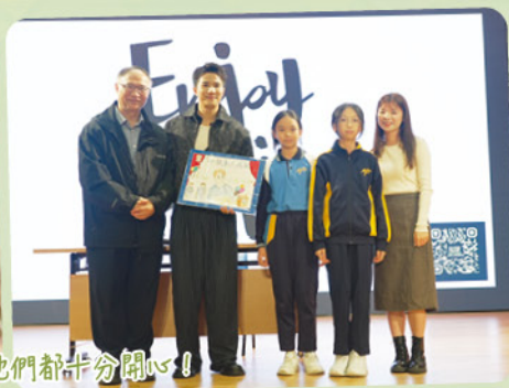
為感謝嘉賓，同學親手創作嘉賓的人像畫並送贈給他們，他們都十分開心！