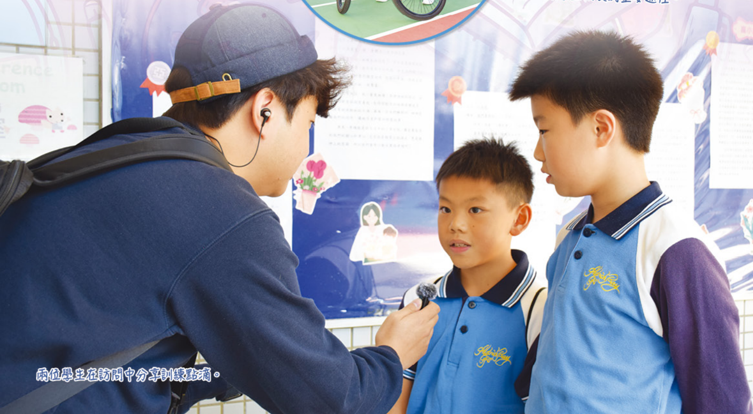
兩位學生在訪問中分享訓練點滴。