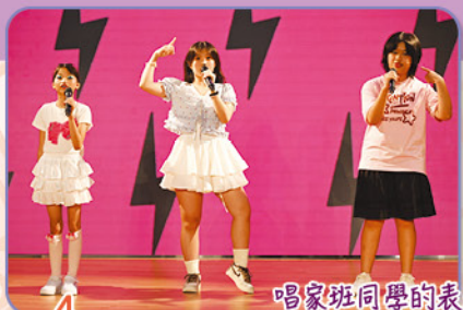
唱家班同學的表演令人印象難忘。同學們既有唱功，又有台風！