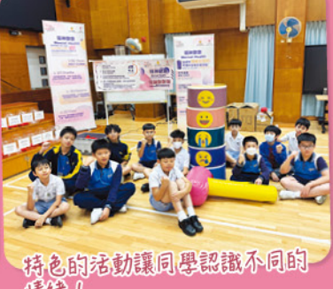
特色的活動讓同學認識不同的情緒！