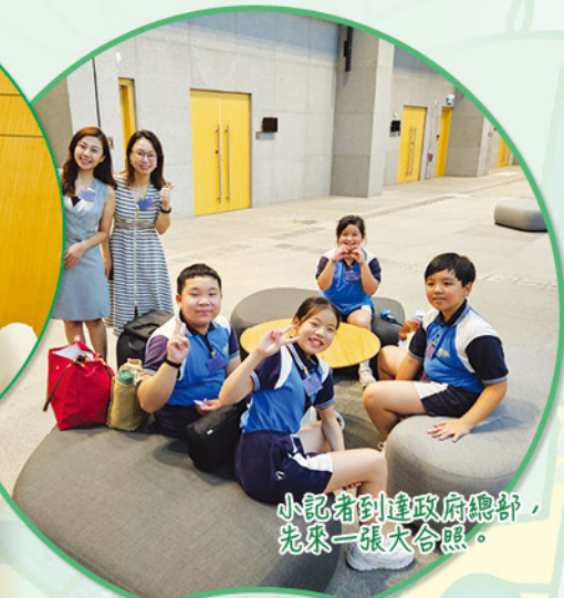
小记者到達政府總部，先來一張大合照。