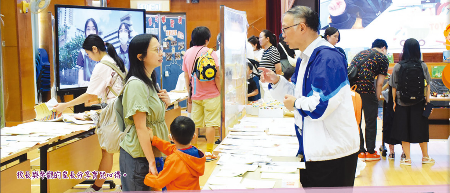
校長與參觀的家長分享育兒心得。