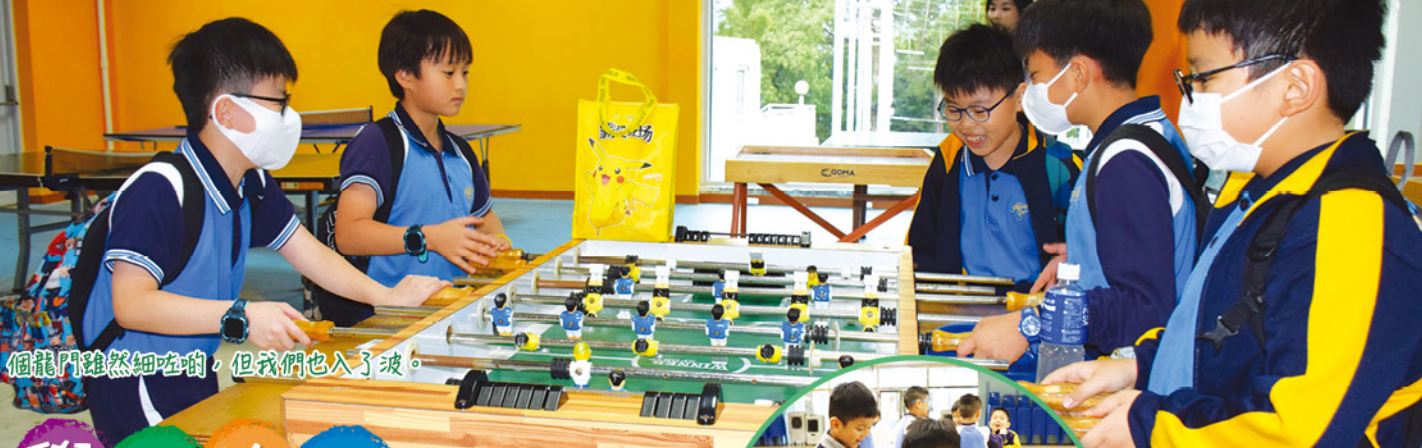
個龍門雖然細啲，但我們也入了波。