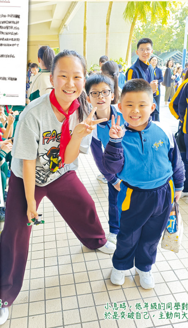
大家交流學習 STEM 的心得。