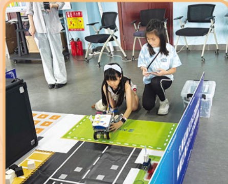
同學緊密合作，確保機械人能精確運行。