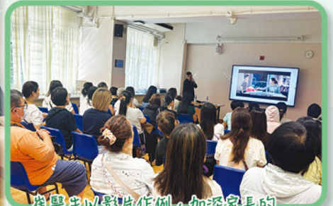
崔醫生以影片作例，加深家長的理解及體會。