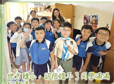
地方雖小，卻阻擋不了同學滿滿的熱情。