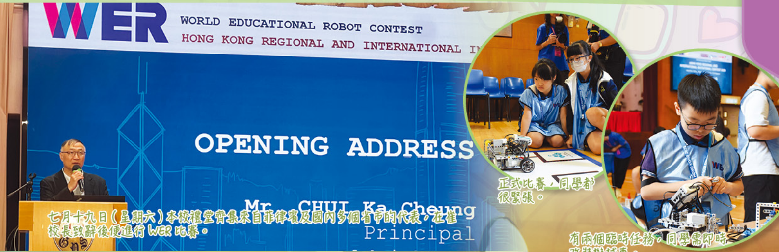
七月十九日(星期六)本校禮堂齊集來自菲律賓及國內多個省市的代表，在崔校長致辭後便進行 WER 比賽。