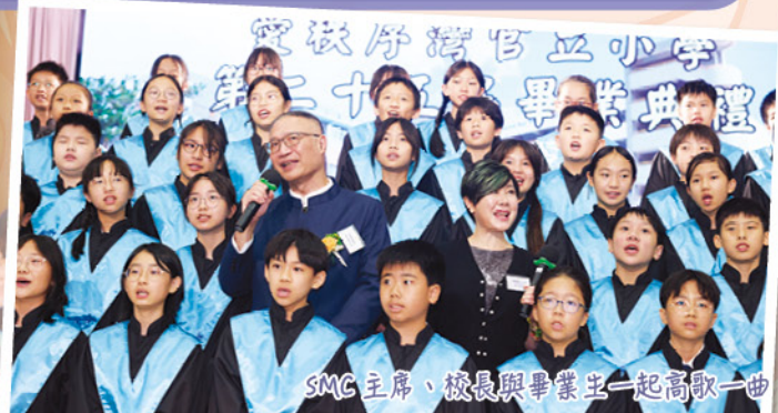
SMC主席、校長與畢業生一起高歌一曲。