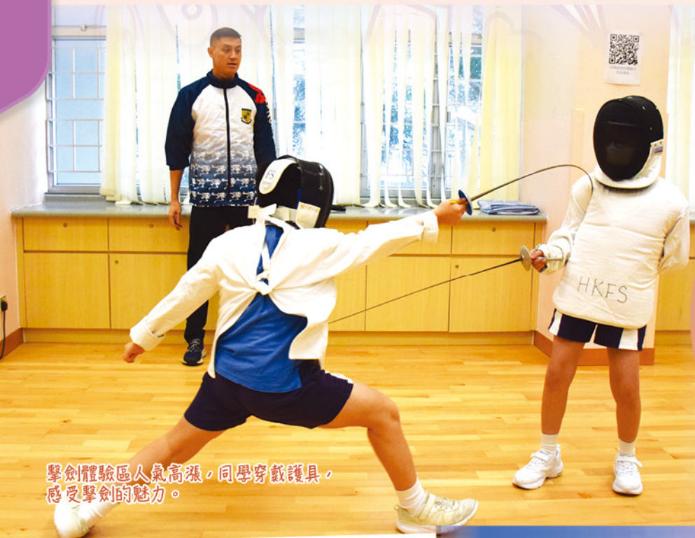
擊劍體驗區人氣高漲，同學穿戴護具，感受擊劍的魅力。