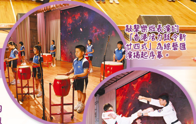
敲擊樂班表演的「香港活幼鼓令新廿四式」為綜藝匯演揭起序幕。

一年一度的「愛官綜藝匯演」於六月二十日（星期五）舉行，吸引超過 600 位嘉賓及師生出席。舞台已成為了孩子們綻放光彩的天地。隨著輕快的音樂響起，中國鼓隊以氣勢打動人心，舞蹈隊以靈動舞姿展現活力、合唱團用童聲治癒人心。小司儀精彩的介紹讓台下歡聲不斷，無樂器伴奏樂隊則展現了勤學苦練的成果。這場盛會不僅是才藝的展示，更見證了 200 多位參與表演的同學們的自信與成長，為校園生活留下最燦爛的珍貴回憶。