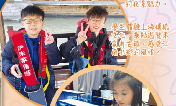
學生體驗上海傳統文化，乘船遊覽朱家角古鎮，感受江南水鄉的風情。