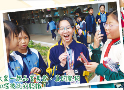
大家一起品嚐美食，真的能夠加深彼此的認識！