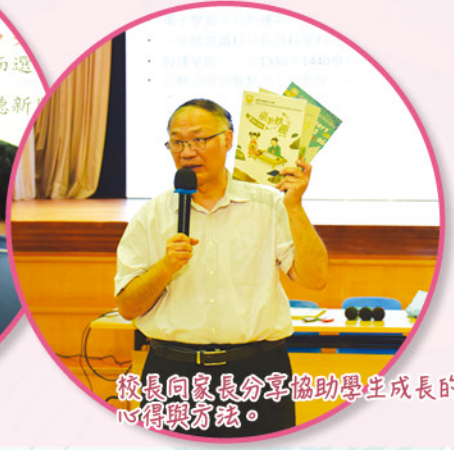
校長向家長分享協助學生成長的心得與方法。