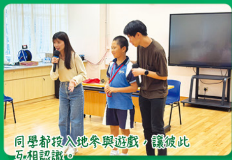
同學都投入地參與遊戲，讓彼此互相認識。

本年度於十月二十七日（星期一）舉辦了插班生適應活動，協助他們適應新的校園生活，還透過集體遊戲讓新同學互相認識，建立友誼，守望相助。同時，也讓他們知道，當遇到任何問題時，老師和社工都會為他們提供適切的支援。