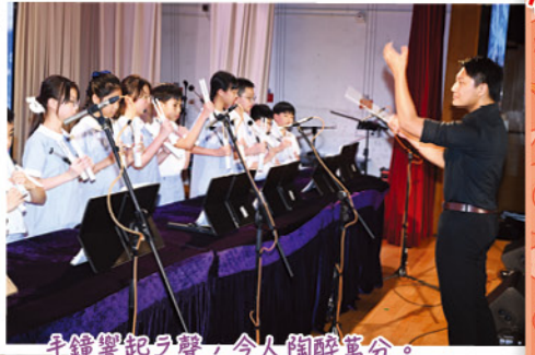
手鐘響起之聲，令人陶醉萬分。