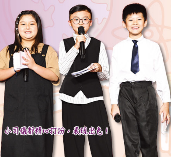
小司儀都精心打扮，表現出色！