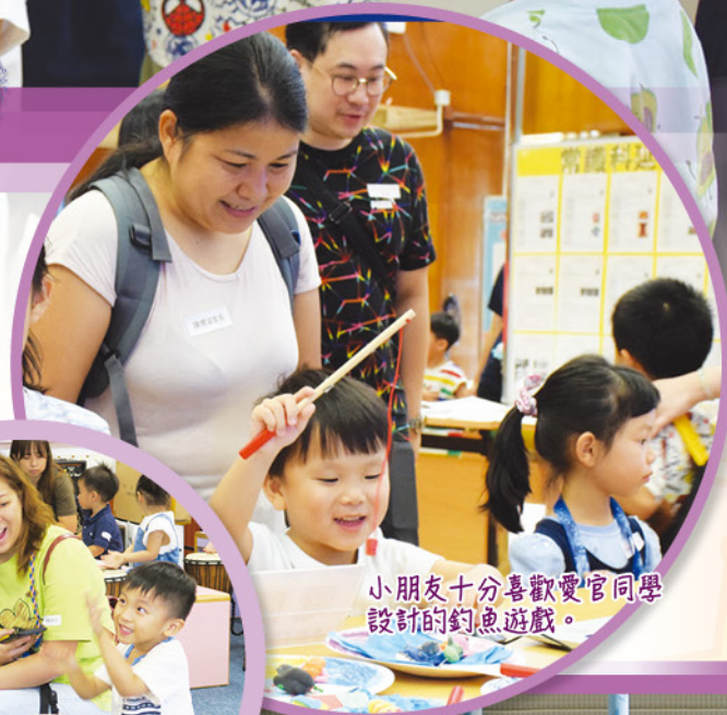
小朋友十分喜歡愛官同學設計的釣魚遊戲。

本校於二零二五年九月十三日（星期六）舉行「幼稚園課程體驗日」。當天，數十位家長及小朋友出席是次課程體驗日的活動，在老師及家長義工帶領下，家長及小朋友體驗愛官好玩、有趣的學習經歷，包括單車、非洲鼓體驗和英語活動等，以及參觀愛官學生作品展，深度了解愛官的學習生活。