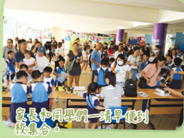
家長和同學們一看早便到校集合。