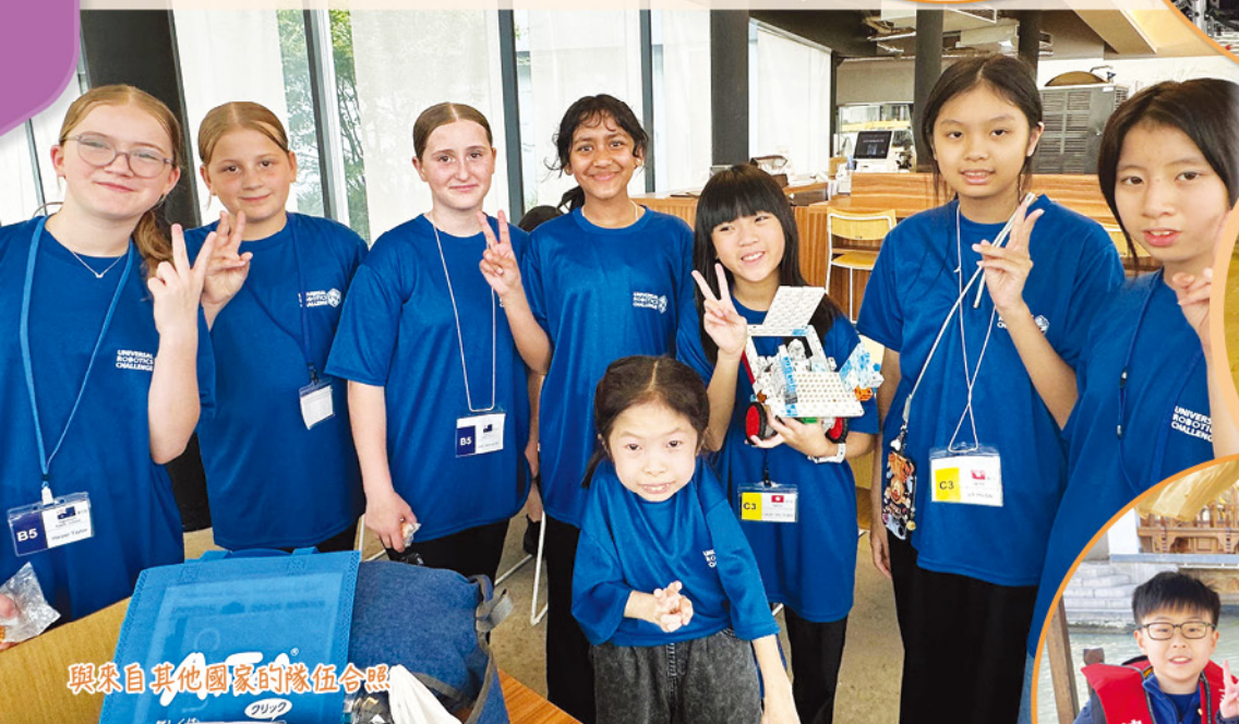
與來自其他國家的隊伍合照