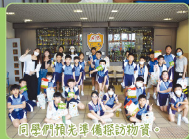
同學們預先準備探訪物資。

主動與長者交談，並耐心教導他們「十巧手」手部拍打運動，鼓勵長者多作養生運動，最後送上禮物和祝福。活動後，學生分享活動過程中的經歷和感受，更親身明白到長者的生活情況和需要，並表示會在生活中多關心身邊的人。