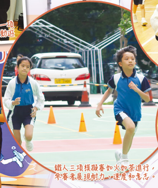
鐵人三項模擬賽如火如荼進行，參賽者展現耐力、速度和意志。