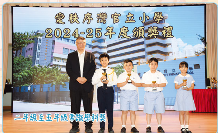
二年級至五年級常識學科獎