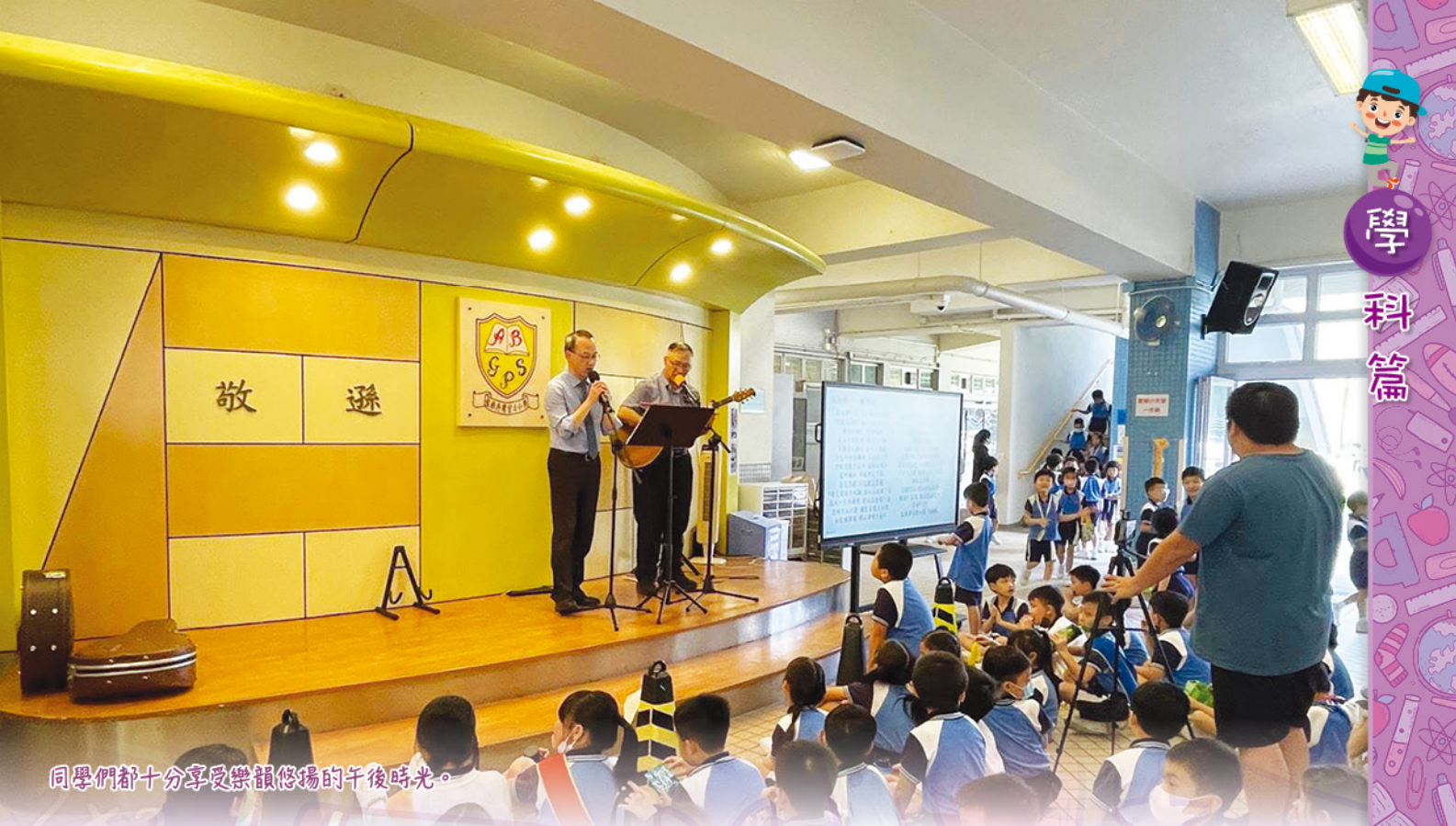
同學們都十分享受樂韻悠揚的午後時光。