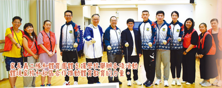
家長義工隊和體育團體支援學校舉辦各項活動，體現家校和社區合作推動體育教育的力量。