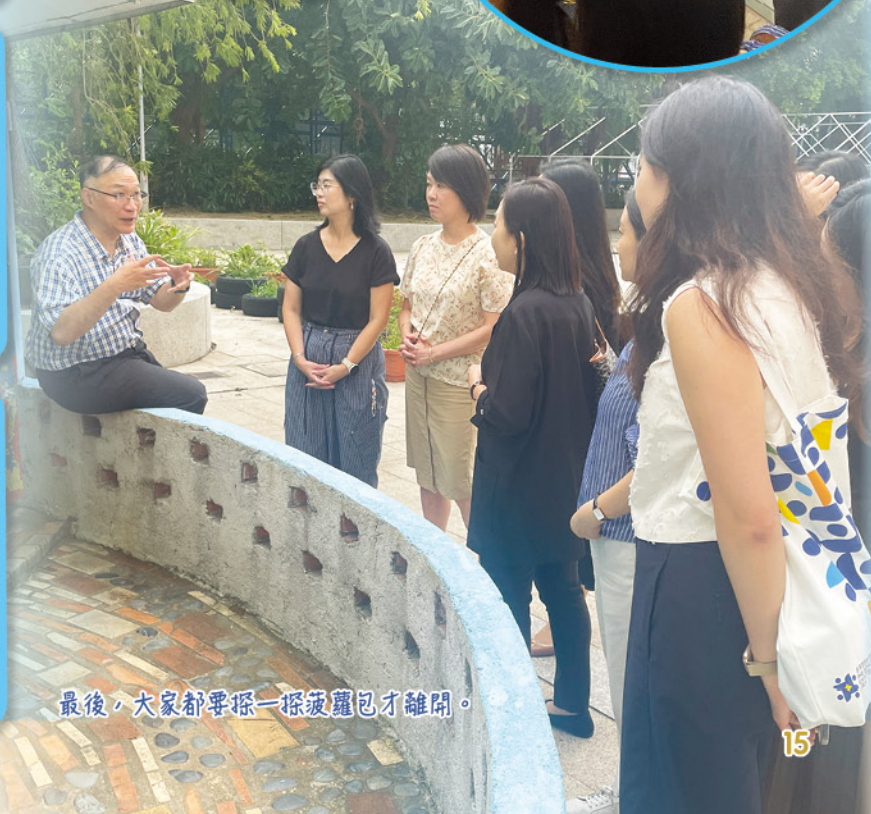
最後，大家都要搵一搵菠蘿包才離開。