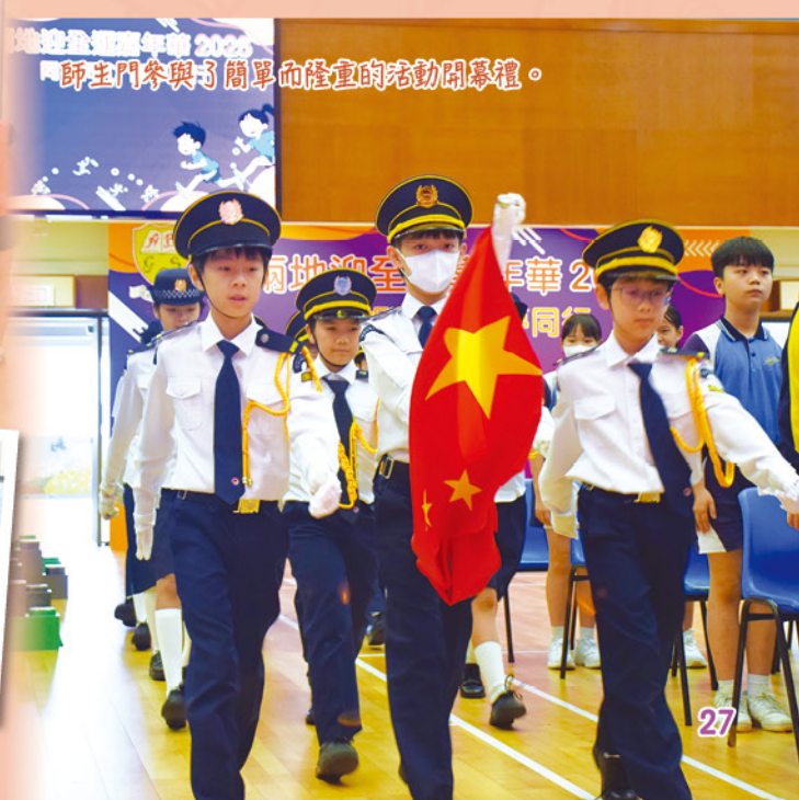
師生們參與了簡單而隆重的活動開幕禮。