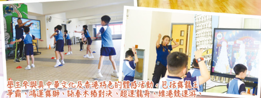
學生參與具中華文化及香港特色的體感活動，包括舞龍互爭霸、鴻運舞獅、詠春木椿對決、超速龍舟、維港競速游、包山狂熱、疾走獅子山、高速單車戰等項目。