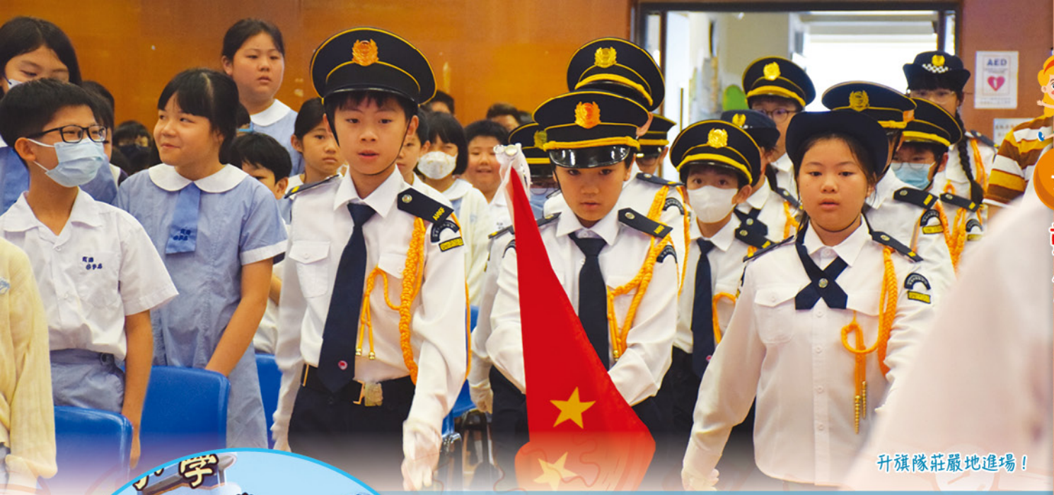
升旗隊莊嚴地進場！