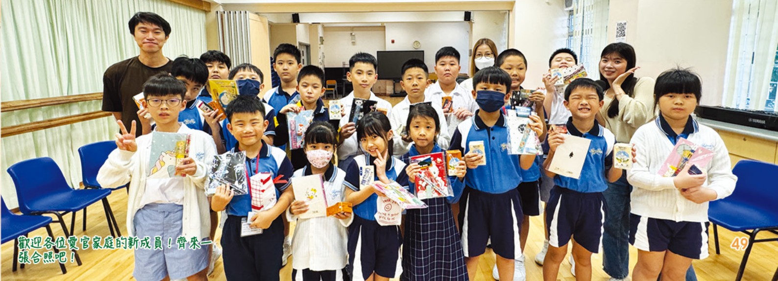
歡迎各位愛官家庭的新成員！齊來一張合照吧！