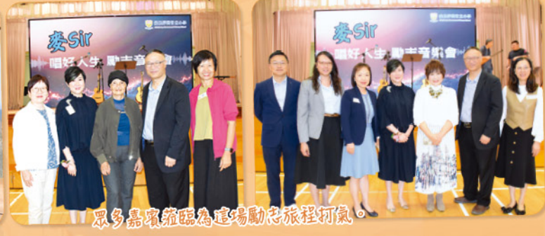
眾多嘉賓蒞臨為這場勵志旅程打氣。