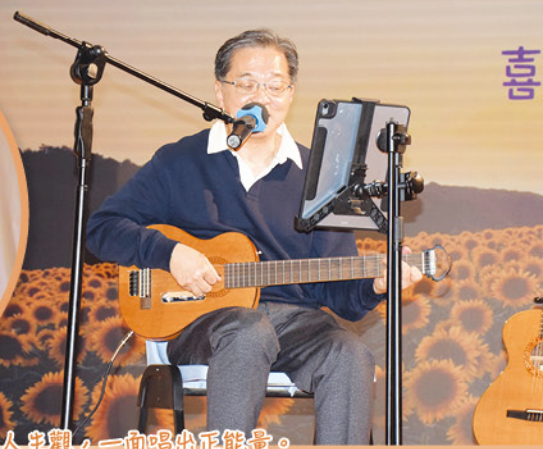
麥Sir 一面講說正向人生觀，一面唱出正能量。