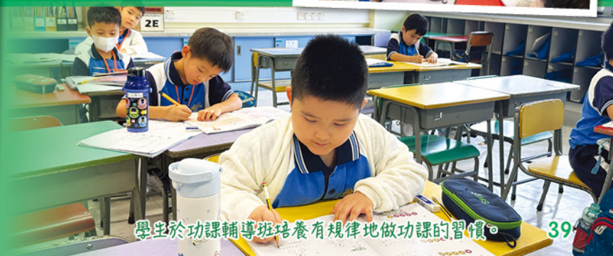
學生於功課輔導班培養有規律地做功課的習慣。