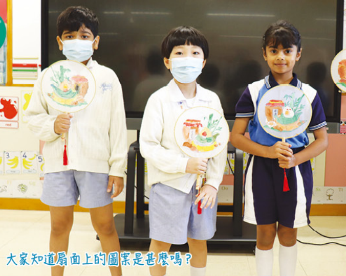
大家知道扇面上的圖案是甚麼嗎？

為了支援非華語學生學習中文，本校於二零二五年七月初舉辦暑假中文試後班。學生透過文化體驗，如：手捏陶胚、扇面彩繪等，加深認識中華文化。