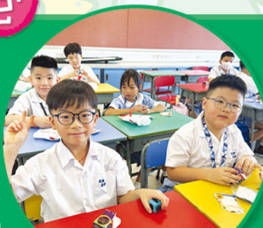
同學收到開學打氣包都急不及待使用！

學校在九月一日（星期一）開學日向同學派發了「開學打氣包」，包括減壓魔方及正向語句家課冊夾，鼓勵學生培養正向情緒，並以正確的方式表達情緒及釋放壓力。另外，打氣包亦附贈心意卡，讓家長寫上鼓勵說話，為子女打氣。有關鼓勵卡已張貼在操場上的壁報板上展示，為全校學生打氣。