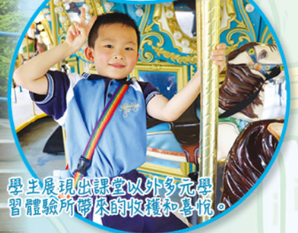
學生展現出課堂以外多元學習體驗所帶來的收穫和喜悅。