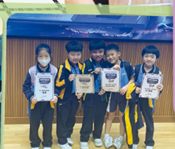
奪獎的一刻，看得見的笑容。