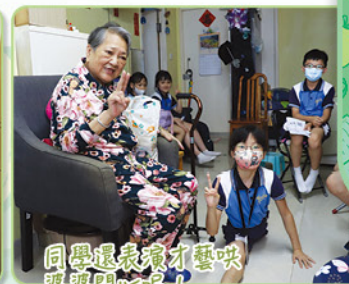
同學還表演才藝哄婆婆開心呢!