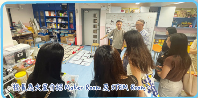
校長為大家介紹Maker Room 及STEM Room。