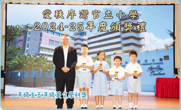
二年級至五年級英文學科獎