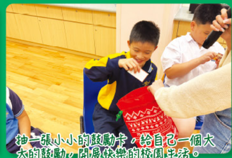
抽一張小小的鼓勵卡，給自己一個大大的鼓勵，開展快樂的校園生活。