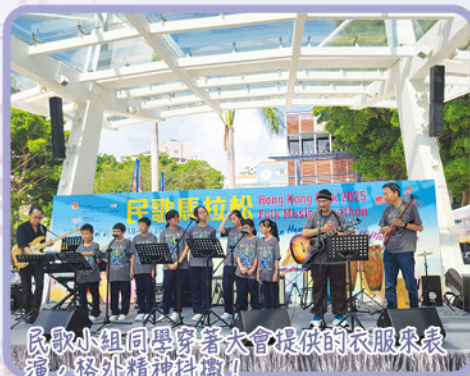
民歌小組同學穿著大會提供的衣服來表演，格外精神抖擻！

愛官學生民歌組有幸於二零二五年十月十八日（星期六）參加全港最大型民歌盛事——民歌馬拉松。當天，同學們於上午 11 時在赤柱廣場參與表演。民歌馬拉松是由一群熱愛民歌的有心人主辦的有意義活動，為全港市民帶來唱民歌的樂趣。二十多隊民歌樂隊為大家帶來悠然自得的一天，由早上唱到黃昏。