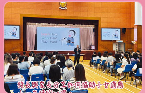
校長與家長分享如何協助子女適應小一生活的心得。