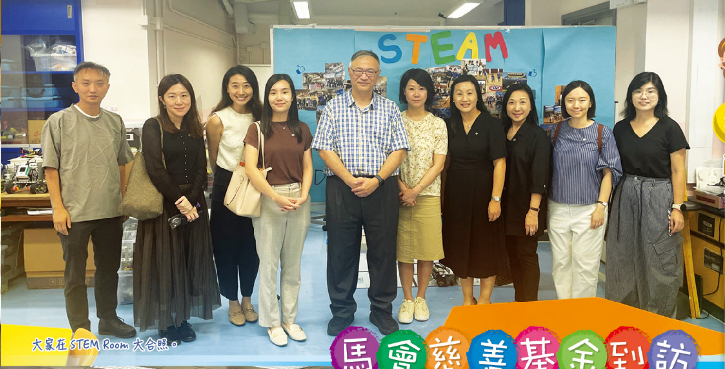
大家在STEM Room 大合照。