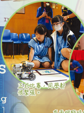
正式比賽，同學都很緊張。