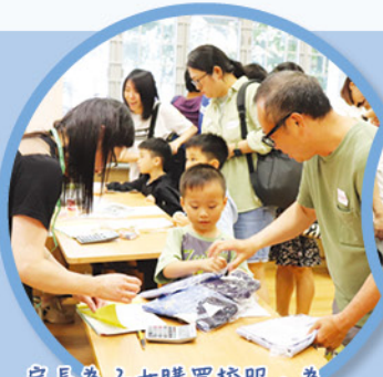
家長為子女購買校服，為開學做好準備！