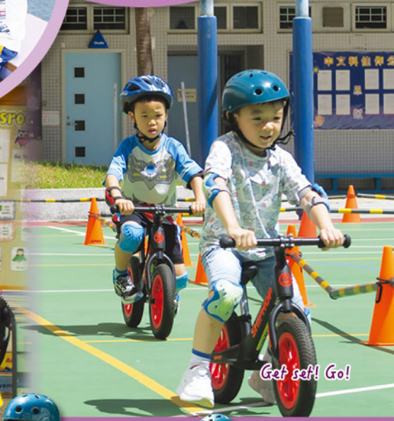
Get set! Go!