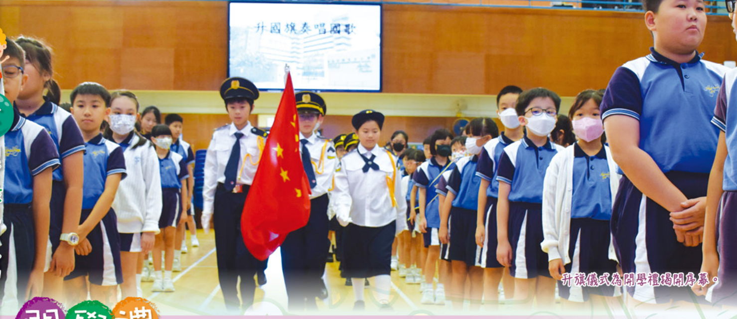
升旗儀式為開學禮揭開序幕。