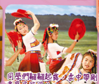
同學們翩翩起舞，柔中帶剛，盡展民族風!