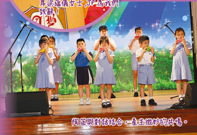
陶笛與對話結合，產生微妙的共鳴。