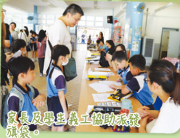
家長及學生義工協助派發旗袋。