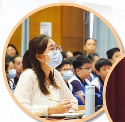
評判老師認真地欣賞表演。

是次比賽初級組（一、二年級）共有 10 個參賽隊伍；中級組（三、四年級）共有 20 個參賽隊伍；高級組（五、六年級）共有 19 個參賽隊伍。