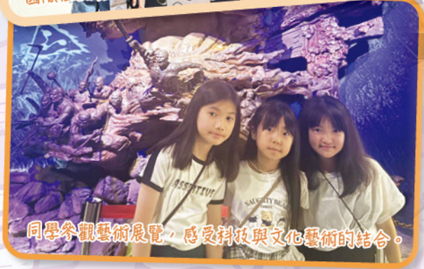
同學參觀藝術展覽，感受科技與文化藝術的結合。