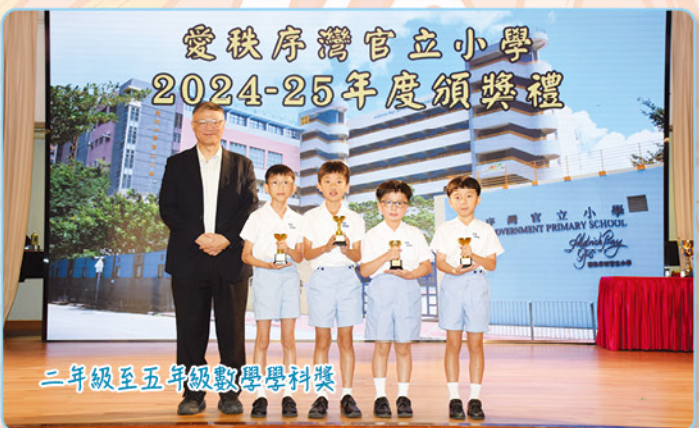
二年級至五年級數學學科獎