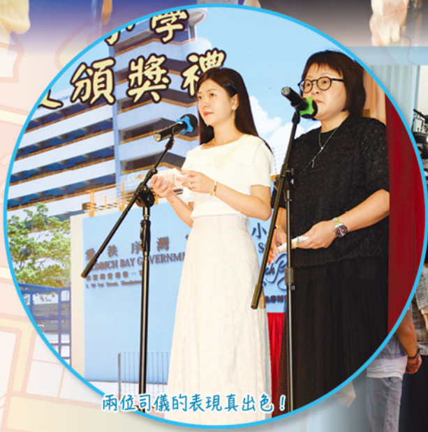
兩位司儀的表現真出色！