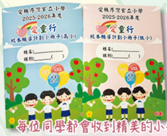
每位同學都會收到精美的小冊子！

本學年校本輔導活動的重點為「仁愛、尊重他人、孝親」三方面的正向價值觀，培養同學樂觀積極及正面思維的精神，建立校園正向文化。學期初向全校同學派發「愛童行」校本輔導計劃小冊子，透過訂立目標和反思，紀錄學生在正向價值觀方面的學習和成長。