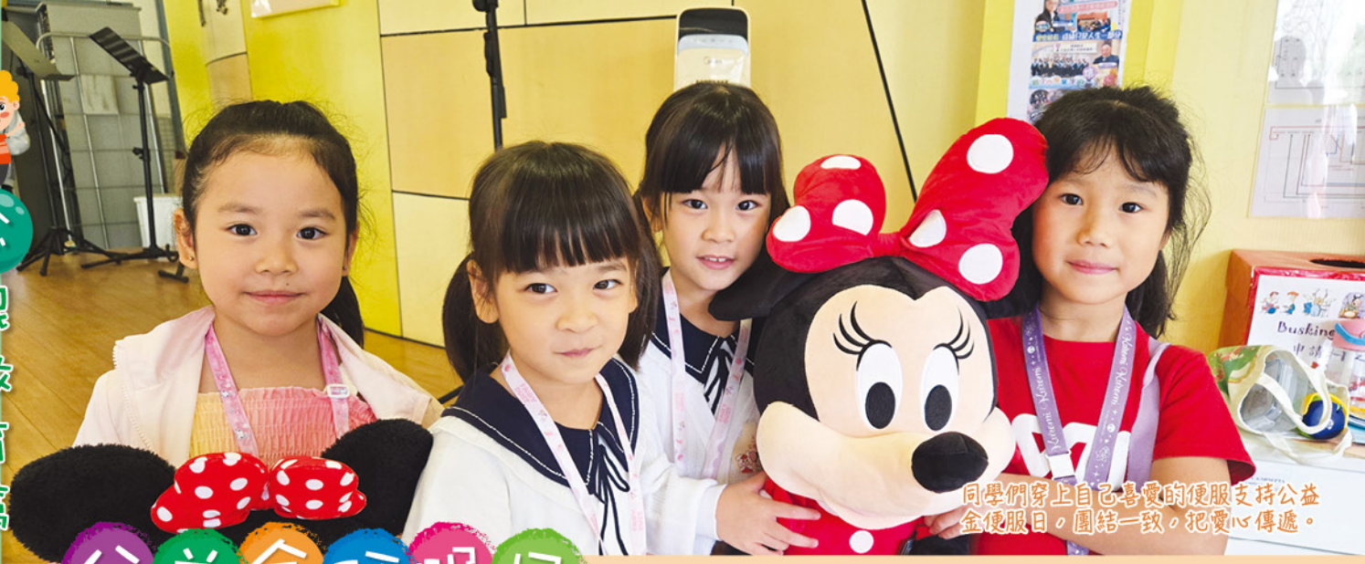
同學們穿上自己喜愛的便服支持公益金便服日，團結一致，把愛心傳遞。