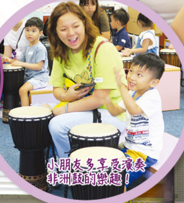
小朋友多享受演奏非洲鼓的樂趣！