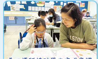
義工導師協助學生完成家課及溫習。