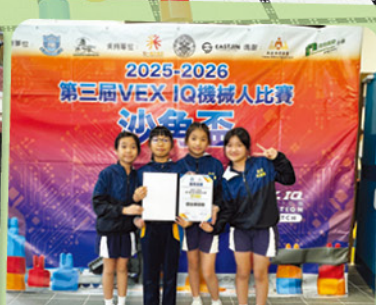
長途跋涉到達禁區，還好能帶走好成績。