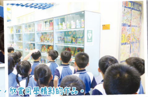
大家走到視藝室門外，欣賞同學精彩的作品。