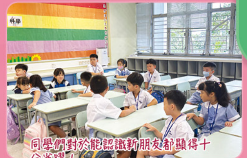
同學們對於能認識新朋友都顯得十分雀躍！