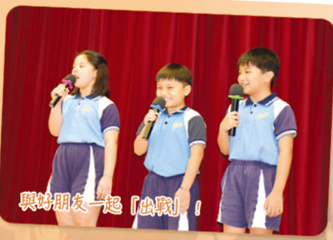
與好朋友一起「出戰」！