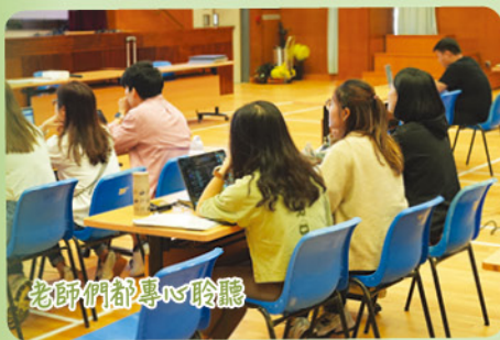
老師們都專心聆聽

在第三個環節，AI 教師工作坊中，教師會探索不同的 AI 工具，包括 Magice School, Felo AI 及 Deepseek，然後我們會再探討使用 AI 工具時的應有態度。