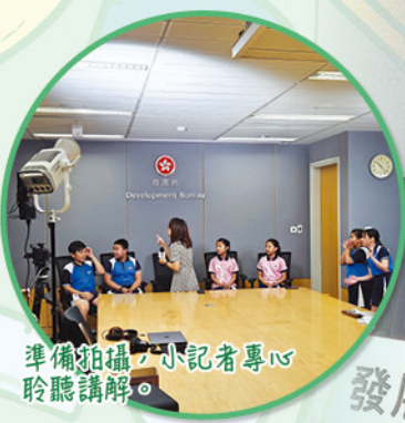
準備拍攝，小记者專心聆聽講解。