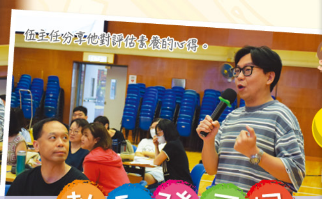
伍主任分享他對評估素養的心得。