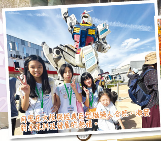
同學在大阪與經典巨型機械人合照，激發對未來科技發展的熱情。