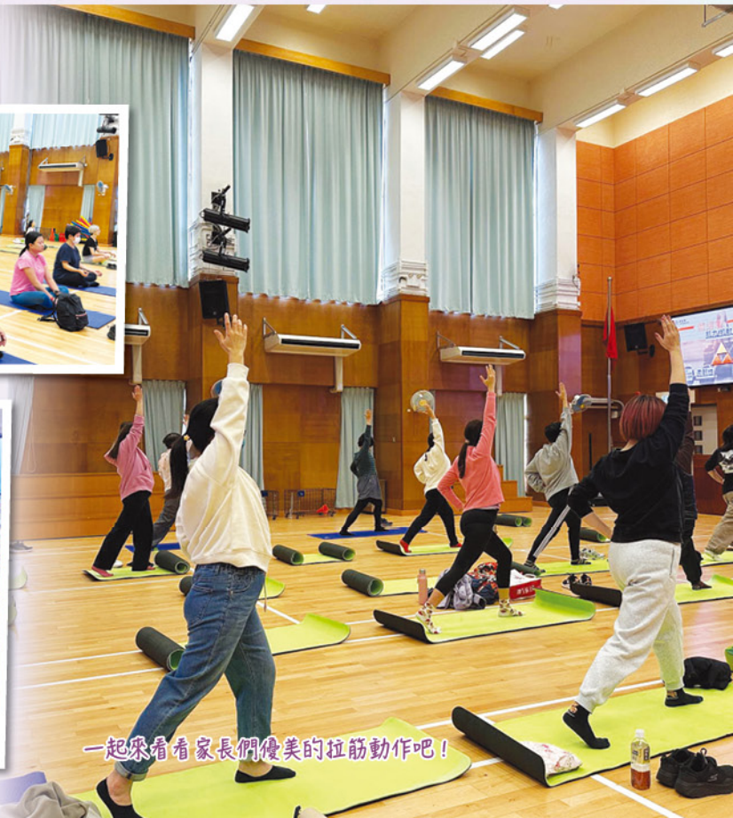
一起來看看家長們優美的拉筋動作吧！