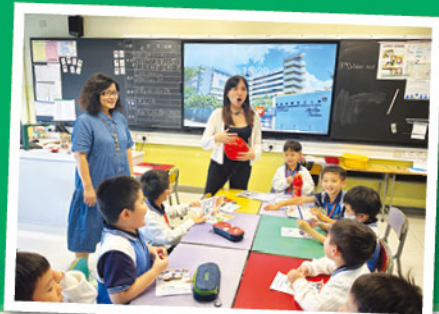
透過小組遊戲促進學生的社交能力及學習情緒控制。

為協助本年度小一同學適應學校生活，並增強社交及情緒管理能力，學校與「香港仔坊會」及「奇趣學藝坊」合作舉辦小一適應課程，當中包括小一適應小組及功課輔導班。