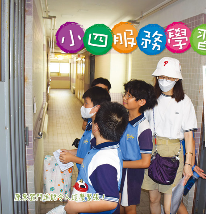
原來登門造訪令人這麼緊張!