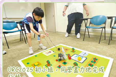
URC2025 初小組，同學盡力地完成任務。