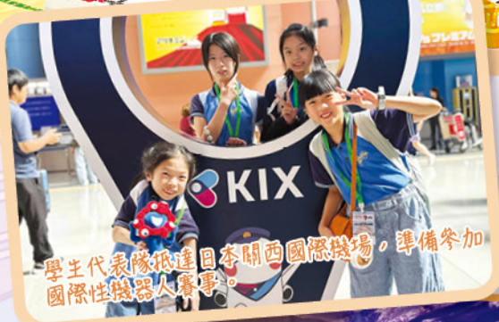
學生代表隊抵達日本關西國際機場，準備參加國際性機器人賽事。