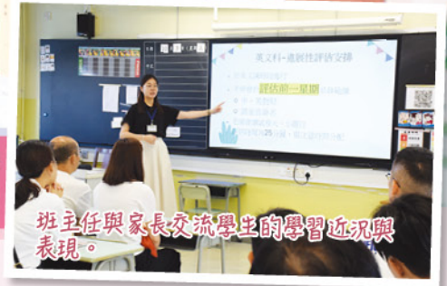
班主任與家長交流學生的學習近況與表現。

本校於二零二五年十月四日（星期六）舉行一至六年級分級家長會。當日，各科老師向家長講解課程重點、分析學生應試表現，並提供改善學習難點的建議，協助家長掌握子女的學習狀況，以更有效率地進行指導。中文及英文科亦重點介紹如何運用人工智能輔助教學，例如透過互動學習平台及智能寫作工具，豐富學生的語言學習體驗，從而提升學習興趣與表現。家長亦與班主任面談，深入了解子女在校表現。是次家長會成效顯著，有效加強家校合作，共同促進學生的學習與成長。