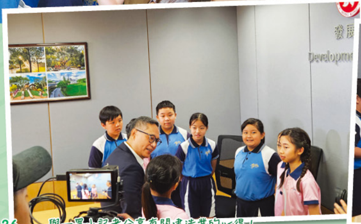
36 與一眾小记者分享有關建造業的心得！