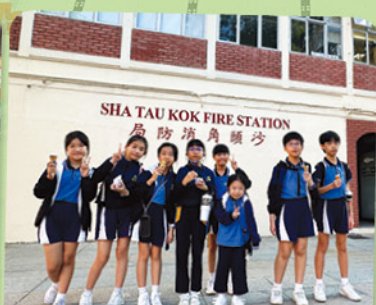
STEM TEAM 第一次到沙頭角禁區比賽。