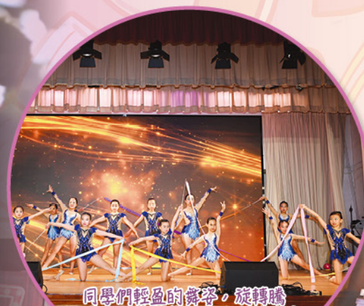
同學們輕盈的舞姿，旋轉騰躍，彩帶飛舞，真是與美的完美結合。