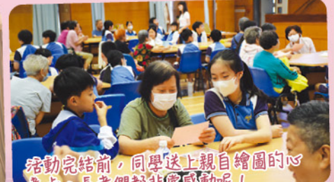
活動完結前，同學送上親自繪圖的心意卡。長者們都非常感動呢!