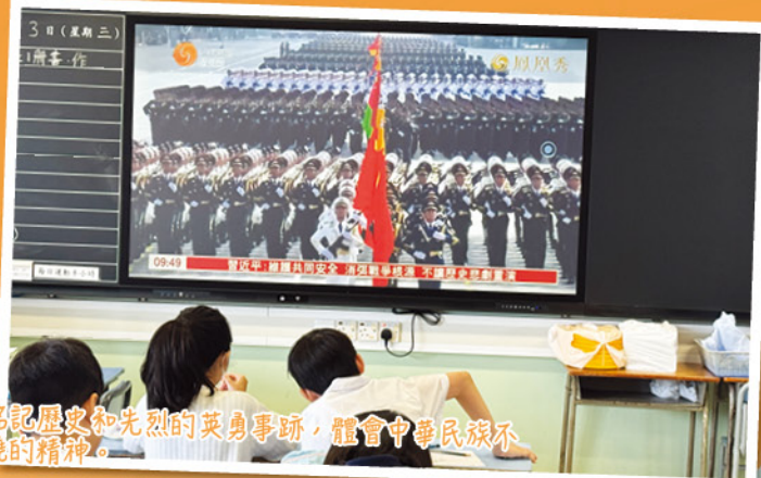
師生銘記歷史和先烈的英勇事跡，體會中華民族不屈不撓的精神。

為了讓同學認識抗戰歷史，當天學校舉行了升旗禮，奏唱國歌以及配合紀念抗戰的國旗下的講話，當天上午亦特別安排了同學收看閱兵儀式，藉此培養同學的國民身份認同及民族自豪感，並增強他們維護國家安全的意識和責任感，以傳承愛國精神。