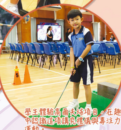
學生體驗高爾夫球項目，在趣味中認識這項講究禮儀與專注力的運動。