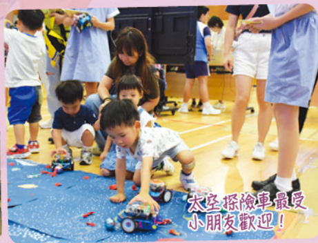
太空探險車最受小朋友歡迎！