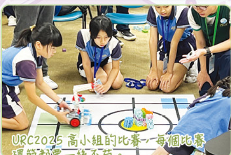
URC2025 高小組的比賽，每個比賽環節都要一絲不苟。