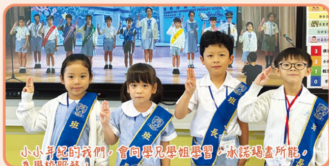
小小年紀的我們，會向學兄學姐學習，承諾竭盡所能，為學校服務！