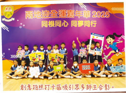
創意拍照打卡區吸引眾多師生合影。