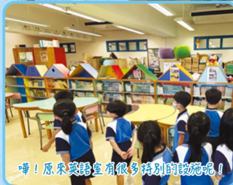
嘩！原來英語室有很多特別的設施呢！