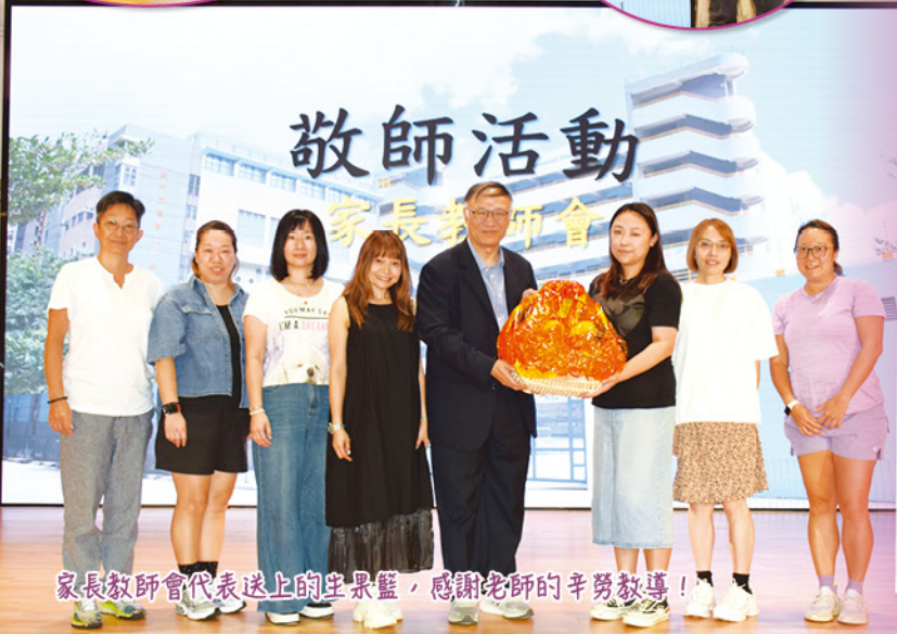
家長教師會代表送上的生果籃，感謝老師的辛勞教導！