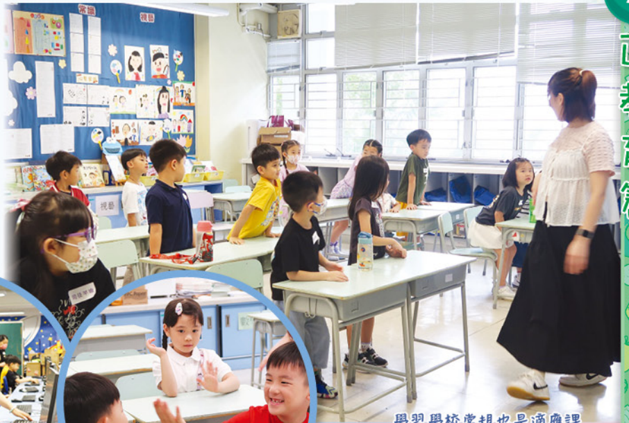
學習學校常規也是適應課程的一部份。

本校於二零二五年六月十四日（星期六）舉行小一新生適應日，讓百多位準小一新生能率先投入校園生活和對學校有充份的認識。同學們帶着燦爛的笑容參加由東華三院學生輔導服務舉辦的適應課程，而校長、周主任及社工則與百多位家長分享如何有效支援子女，以助孩子愉快適應小學生活。最後，家長和小朋友更可以一起遊校園，為愉快的小一生活展開序幕！