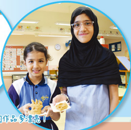
看看我們的作品多漂亮！