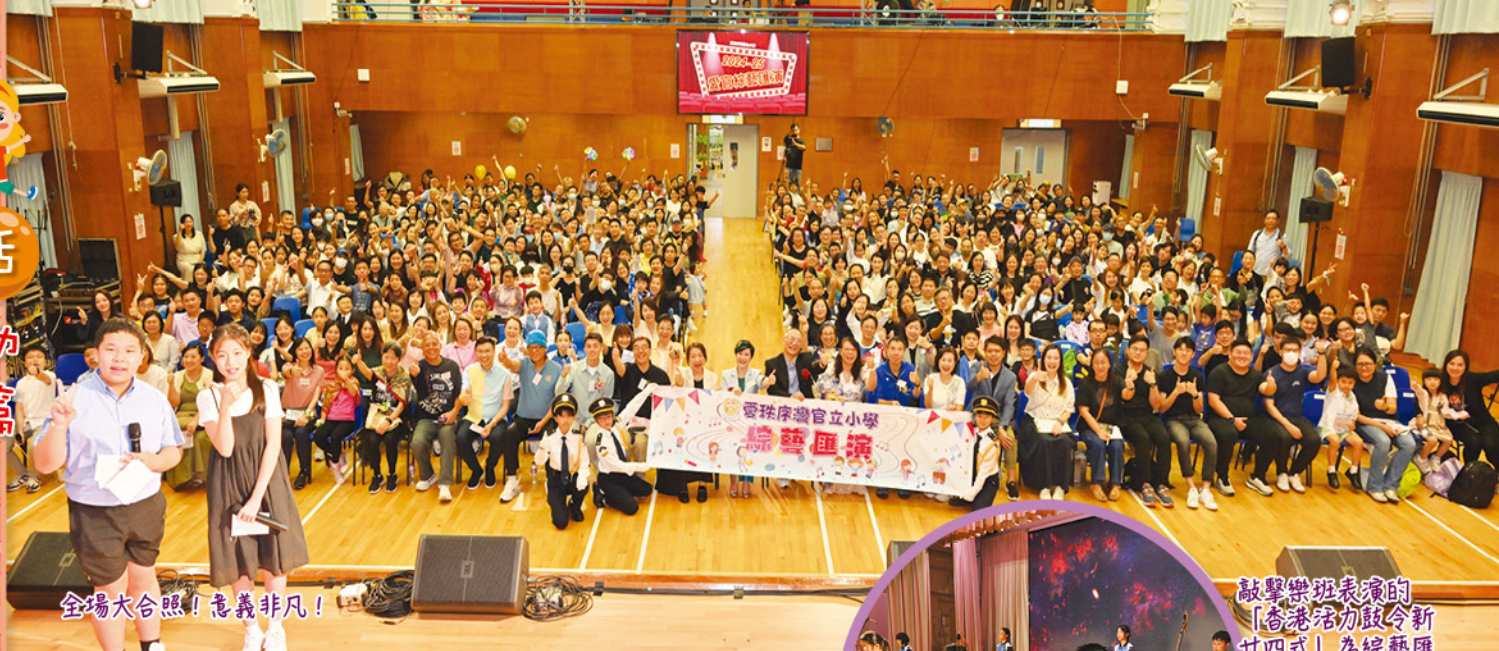
全場大合照！意義非凡！