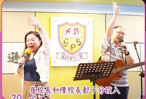
20 崔校長和陳校長都十分投入呢！