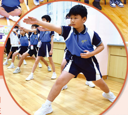
在專業教練指導下，學習擊劍的招牌動作。

為迎接由粵港澳三地首次共同承辦的 2025 年全國運動會，本校積極回應十五運會秉承「簡約、安全、精彩」的辦賽理念，於二零二五年九月二十六日（星期五）舉辦「2025-2026 年度兩地迎全運嘉年華」。活動主題為「同根同心·同夢同行」，旨在深化本校與姊妹學校在體育及文化領域的交流與合作，讓全體學生在參與中感受全運會精神，共築健康活力的大灣區未來。嘉年華活動聚焦其中三項由香港承辦的項目，包括鐵人三項精英運動員分享、高爾夫球、擊劍、互動遊戲體驗、鐵人三項賽、展覽等，唯因颱風影響，四所姊妹學校只能透過線上參與有關活動。