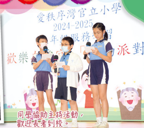
同學協助主持活動，歡迎長者到校。