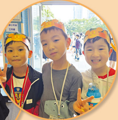
同學們用行動展現關懷，實踐熱心助人的精神，為有需要的人籌募善款。