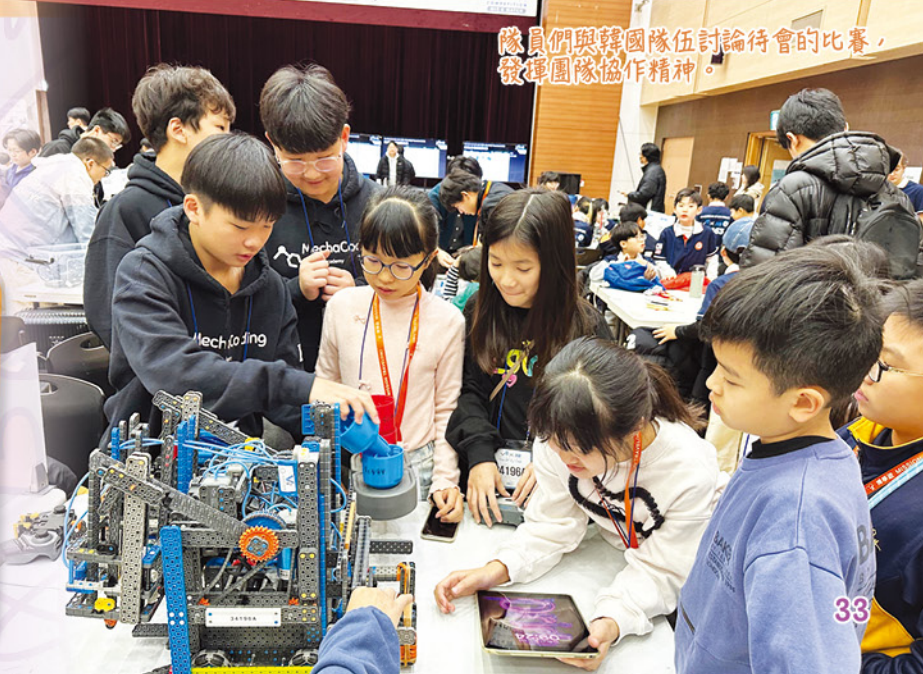
隊員們與韓國隊伍討論待會的比賽，發揮團隊協作精神。