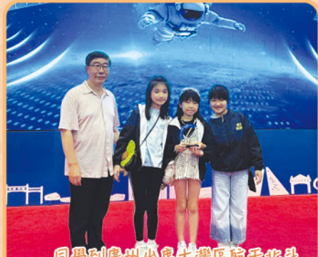
同學到廣州出席大灣區航天北斗衛星導航編程比賽 2025，領獎的一刻。