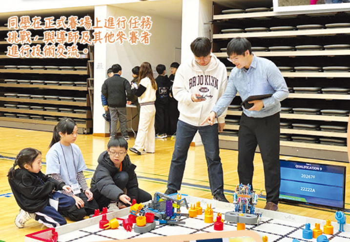
同學在正式賽場上進行任務挑戰，與導師及其他參賽者進行技術交流。