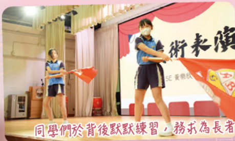
同學們於背後默默練習，務求為長者帶來精彩的表演。大家都做到了!