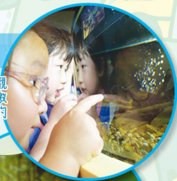
學生在近距離觀察海洋生物，激發對自然生態的好奇心。

本校與明愛社區書院合辦的「區本課後學習及支援計劃」，為學生提供多項支援服務，擴闊學生在課堂以外的學習經驗。其中，師生們於二零二五年六月十三日（星期五）參加「海洋公園全方位學習之旅」活動，享受具教育意義的遊樂體驗，同時提高學生對生態保育的意識。