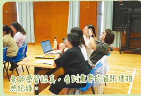
老師學習認真，看到重要的資訊便拍照記錄。