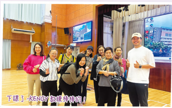
下課了-KENGY教練棒棒滴！