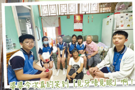
婆婆今次真的笑到「見牙唔見眼」啊!

二零二五年六月，學校與循道衛理中心健樂軒合作，安排學生探訪獨居長者。學生透過親身與長者接觸，了解及關心他們的需要，並送上關心和祝福。在服務中，學生細心聆聽，