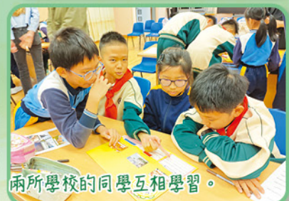
兩所學校的同學互相學習。