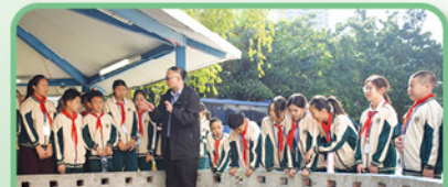
愛官的生命大使「菠蘿包」亦親自接待我們的貴賓，展現愛官熱情好客的精神！

第二天的交流活動更豐富精彩，5位金澤小學的同學參與了愛官的 busking 活動，為我們帶來了活力四射的舞步、剛柔並濟的中華武術、風趣自信的相聲及清脆溫柔的馬林巴琴風演奏，打破了各種年紀、語言的隔膜，引得台下掌聲如雷。接著同學們便分組參與了多元智能課（STEM、武術、跳繩、油畫），兩地同學用雙手創作、用身體感受，互相學習、支持及鼓勵，體現兩地一家的情誼。