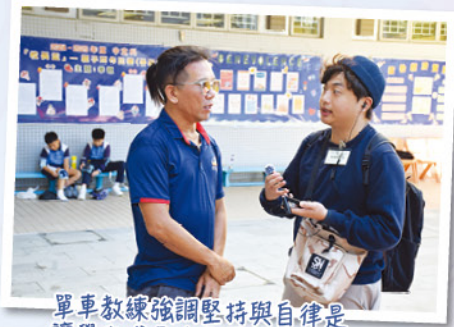
單車教練強調堅持與自律是讓學生成長的重要途徑。