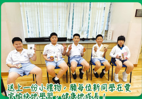
送上一份小禮物，願每位新同學在愛官愉快地學習，健康地成長！