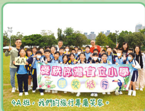
4A班，我們的旅行專屬笑容。