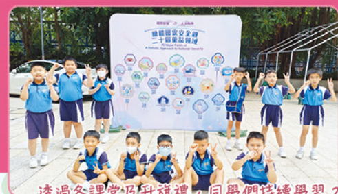
透過各課堂及升旗禮，同學們持續學習 20 個國家安全重點領域的知識。