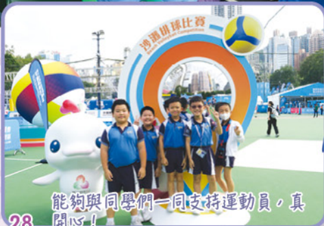
能夠與同學們一同支持運動員，真開心！