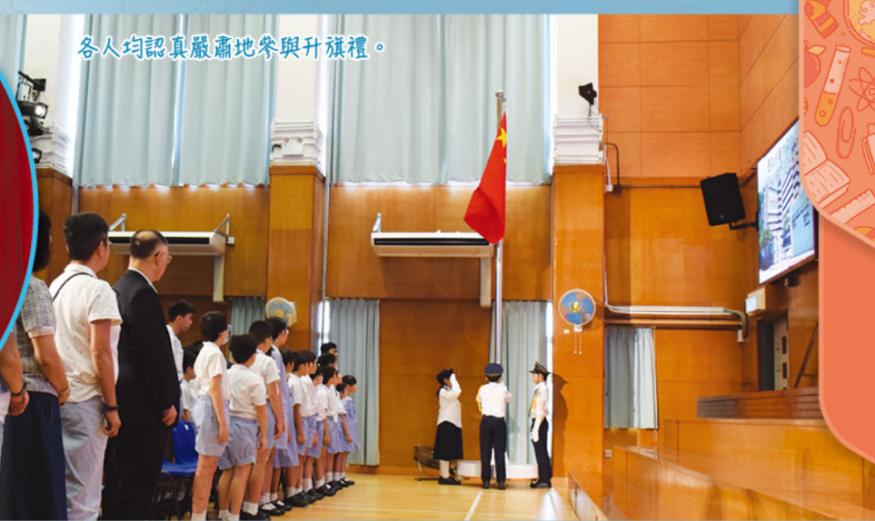
各人均認真嚴肅地參與升旗禮。