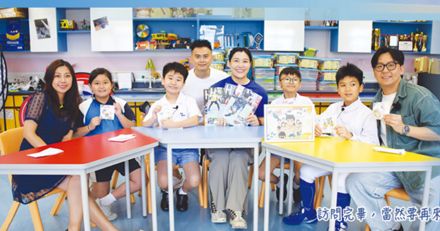
訪問完畢，當然要再來一張大合照啦！