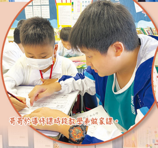
哥哥於導修課時段教學弟做家課。