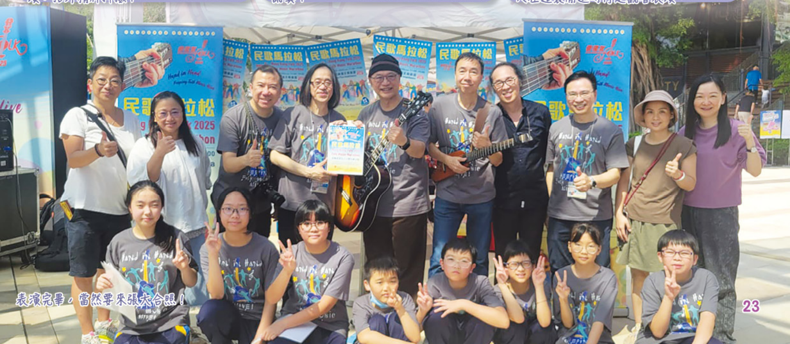
表演完畢，當然要來張大合照！