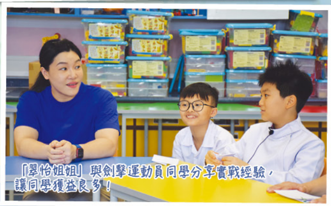
「翠怡姐姐」與劍擊運動員同學分享實戰經驗，讓同學獲益良多！