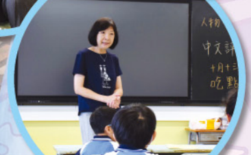
教學助理詳細向同學講解日常的工作。