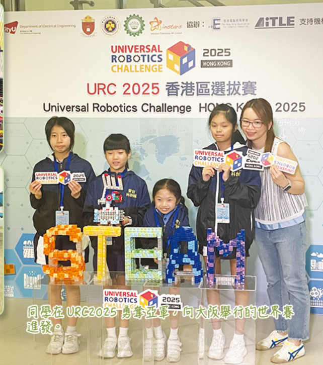
同學在 URC2025 勇奪亞軍，向大阪舉行的世界賽進發。