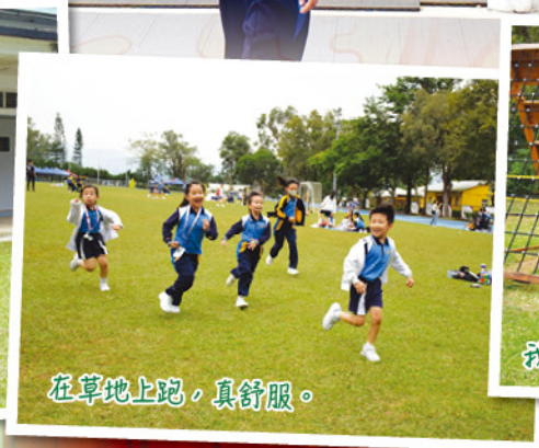
在草地上跑，真舒服。