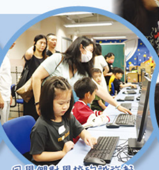
同學們對學校的設施都充滿好奇心！