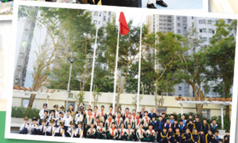
兩所學校的同學大合照。