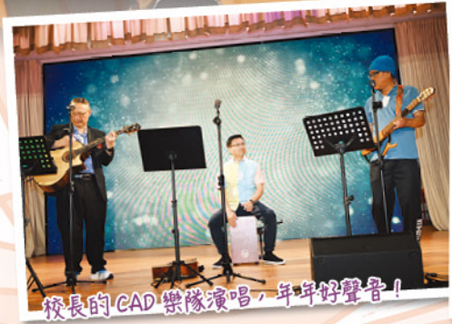
校長的CAD樂隊演唱，年年好聲音!