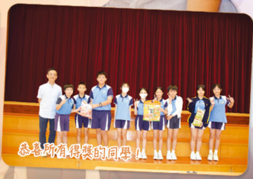
恭喜所有得獎的同學！