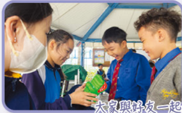
大家與好友一起玩遊戲，十分開心！

「心靈加油站」在十一月份啟用，透過不同的減壓工具、遊戲、減壓資訊，讓同學於小息時參與和使用，從而提升情緒健康，增強情緒管理能力。