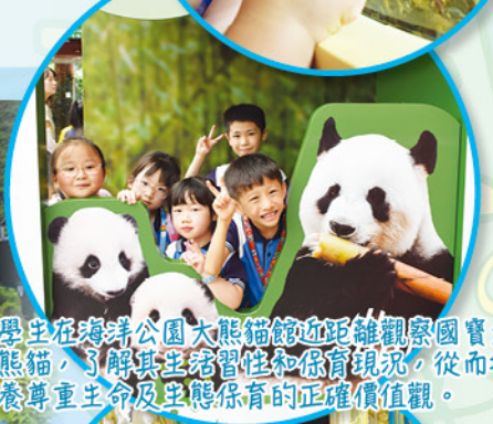
學生在海洋公園大熊貓館近距離觀察國寶大熊貓，了解其生活習性和保育現況，從而培養尊重生命及生態保育的正確價值觀。