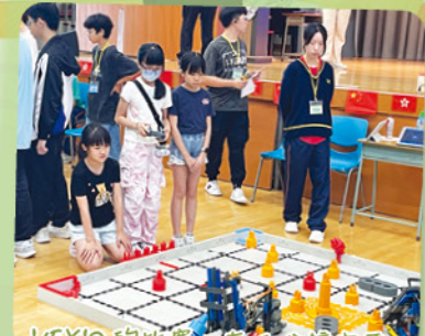
VEXIQ 的比賽，在 1 分鐘內要完成任務，每次都係與時間競賽。