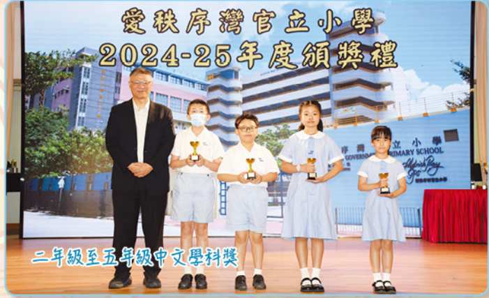
二年級至五年級中文學科獎