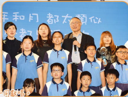
「在晴朗的天空下」，一眾表演同學與各嘉賓一同獻唱。