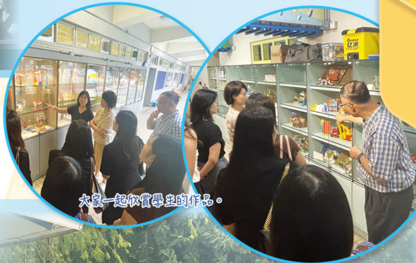
大家一起欣賞學生的作品。