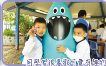
同學們很喜歡可愛有趣的減壓工具！