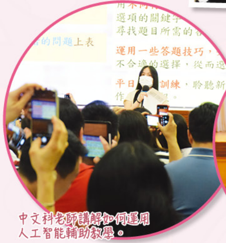
中文科老師講解如何運用人工智能輔助教學。

本校於二零二五年十月四日（星期六）舉行一至六年級分級家長會。當日，各科老師向家長講解課程重點、分析學生應試表現，並提供改善學習難點的建議，協助家長掌握子女的學習狀況，以更有效率地進行指導。中文及英文科亦重點介紹如何運用人工智能輔助教學，例如透過互動學習平台及智能寫作工具，豐富學生的語言學習體驗，從而提升學習興趣與表現。家長亦與班主任面談，深入了解子女在校表現。是次家長會成效顯著，有效加強家校合作，共同促進學生的學習與成長。