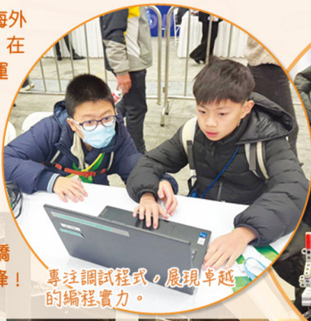
專注調試程式，展現卓越的編程實力。

我校 STEAM TEAM 近期積極參加多項海外比賽，展現出色的機械人設計及編程能力。在廣州的北斗衛星導航編程比賽中，學生們運用最新技術，深化了航天科技的理解。接著，在大阪的 URC 比賽中，隊伍需要團隊合作，隨機應變。在韓國的 VEX IQ 比賽中，學生成功設計智能機器人，展示了他們的創新能力。最後，在上海的 WER 世界教育機器人大賽中，與國際隊伍交流，增強視野和友誼。我們為 STEAM TEAM 的成就感到驕傲，期待他們在未來繼續探索，創造更多高峰！