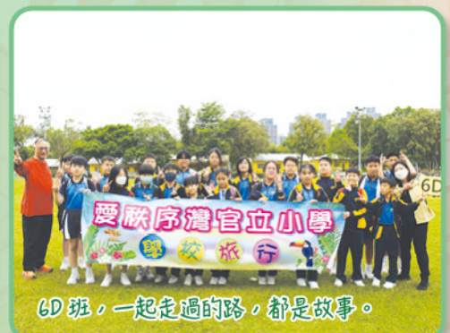
6D班，一起走過的路，都是故事。