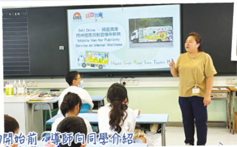
在活動開始前，導師向同學介紹精神健康的資訊。

本校於九月初與聖雅各福群會精靈寶庫合作，為六年級學生舉辦浮游花製作活動。透過活動，讓學生學習舒緩情緒。