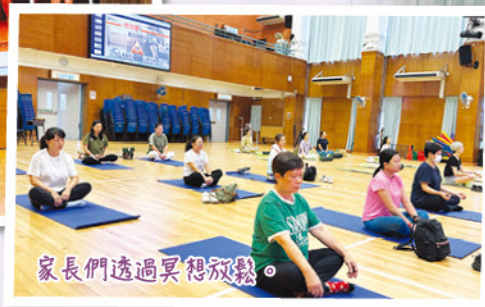
家長們透過冥想放鬆。