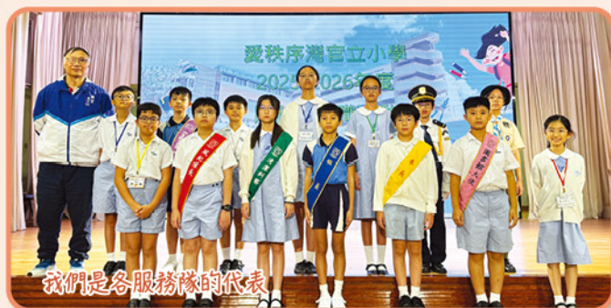
我們是各服務隊的代表。