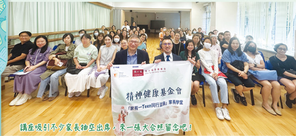
講座吸引不少家長抽空出席，來一張大合照留念吧！