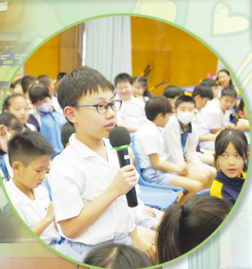
同學們對嘉賓的職業及追尋夢想的經歷甚感興趣，積極向他們發問，充滿好奇心！