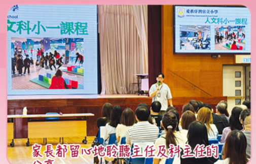
家長都留心聆聽主任及科主任的分享。