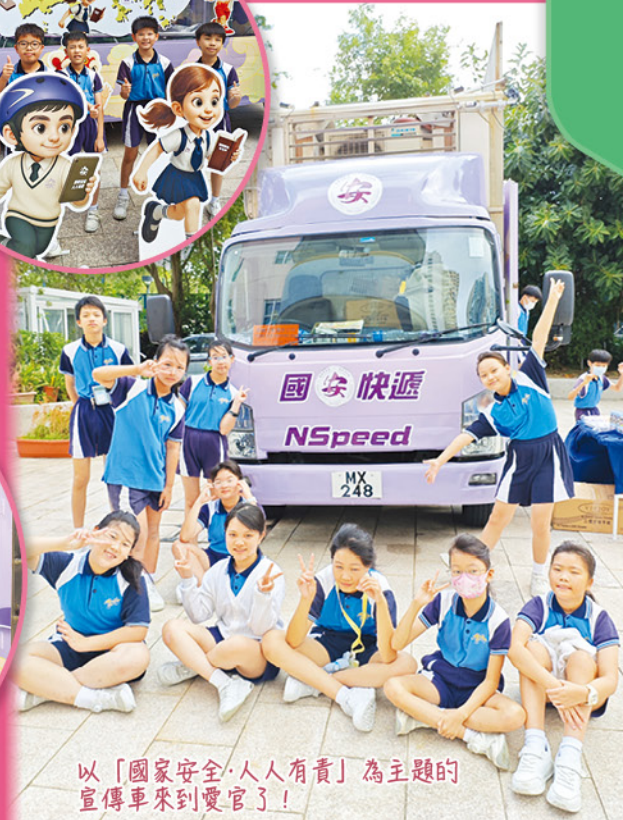
以「國家安全·人人有責」為主題的宣傳車來到愛官了！