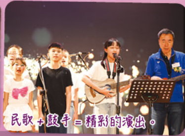
民歌+鼓手=精彩的演出。