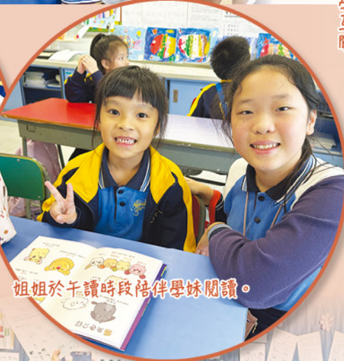
姐姐於午讀時段陪伴學妹閱讀。