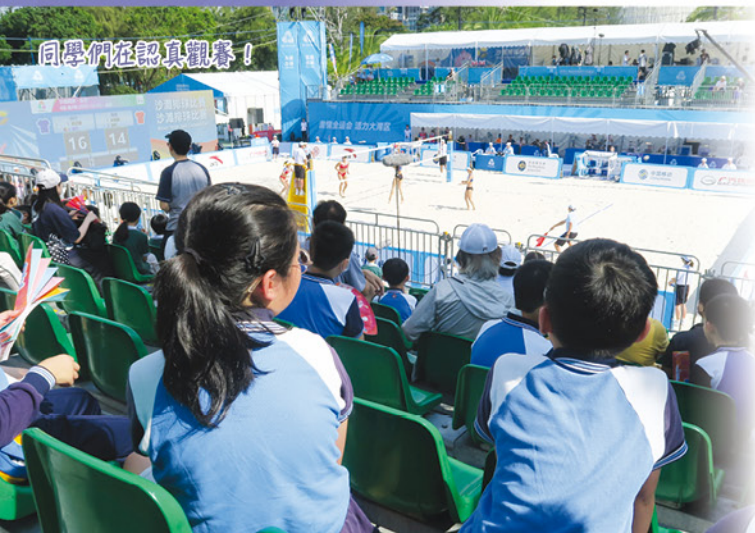
同學們在認真觀賽！

十月三十一日（星期五）由粵港澳三地首次共同承辦的第十五屆全國運動會是國家水平最高、規模最大的全國性大型綜合運動會。愛官同學有幸在維多利亞公園近距離觀賞沙灘排球賽事，還被傳媒訪問，真是一舉兩得，大開眼界。