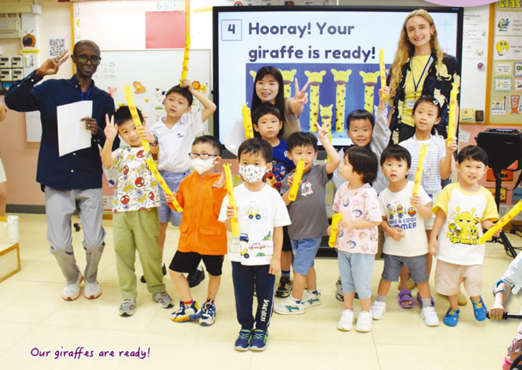
Our giraffes are ready!