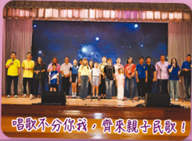
唱歌不分你我，齊來親子民歌!