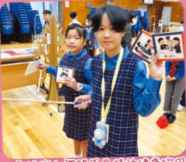
良好的人際關係是精神健康的因素之一，陪伴和支持也是很重要的！