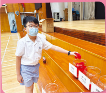
大家選擇自己平日的減壓方法。