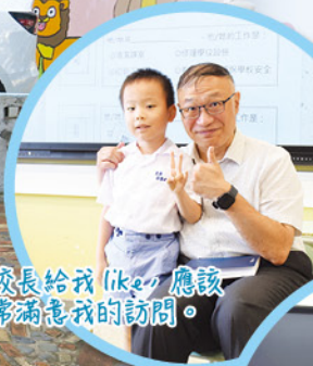
崔校長給我 like，應該非常滿意我的訪問。