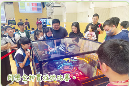
同學全神貫注地比賽。