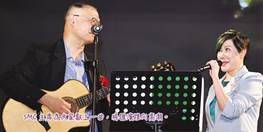
SMC 主席為大家獻上一曲，將匯演推向高潮。