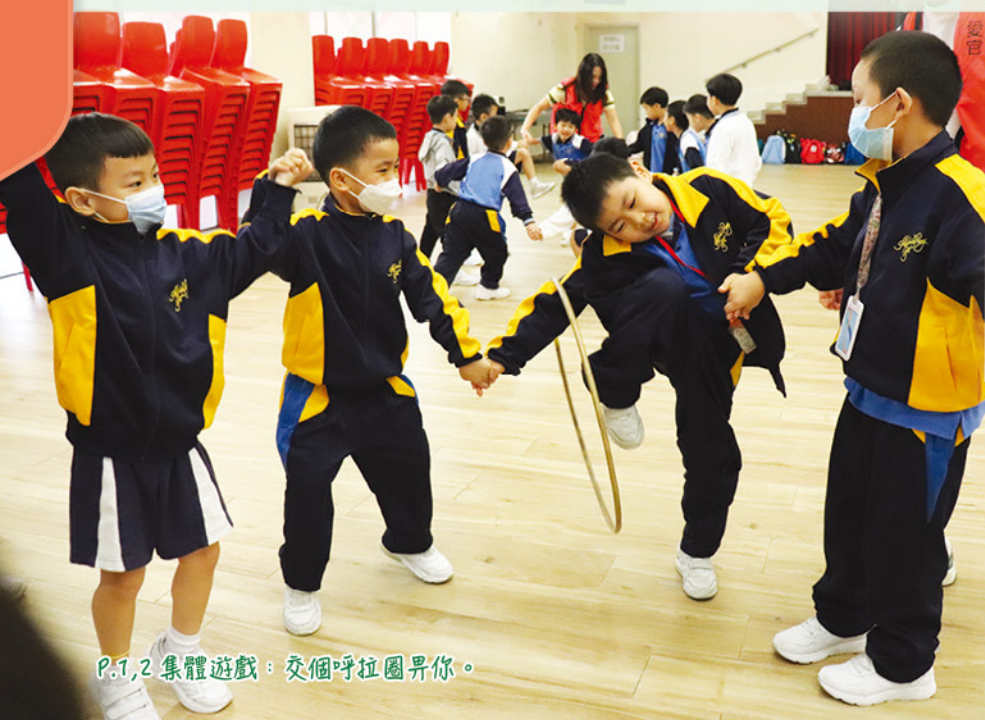
P.1,2 集體遊戲：交個呼拉圈畀你。

這一天，天朗氣清，和煦的陽光伴隨著涼爽的微風，為旅程拉開了完美的序幕。在老師的悉心帶領下，同學們積極參與各項的團體遊戲與活動。大家不分年級，在活動中互相鼓勵、協力合作，不僅留下了無數歡聲笑語，更在不知不覺間加深了彼此的友誼。這次旅行讓課堂延伸至大自然，內容豐富而充實。學生們不僅享受了遊戲的樂趣，更有效提升了溝通技巧與團隊協作精神，可謂收穫豐碩，滿載而歸。