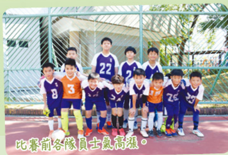
比賽前各隊員士氣高漲。

愛官足球隊於十一月參加了港島東區小學校際五人足球比賽，分組賽頭兩場賽事面對強敵，與對手打成均勢，可惜兩場比賽均力戰而敗。雖然已經無緣出線，但各愛官足球隊成員在第三場分組賽中仍然竭盡全力，最後大勝一場。