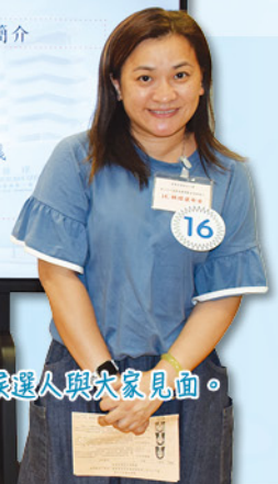
各候選人與大家見面。