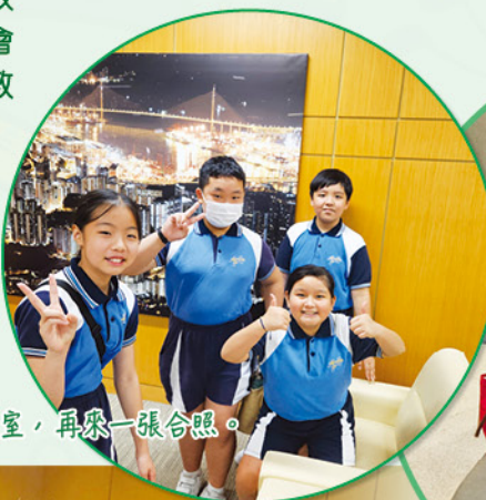
進入辦公室，再來一張合照。

由發展局聯同教育局以及建造業議會、政府工務部門、大學、建造業界組織及專業學會舉辦的「STEAM UP 想建理」計劃，計劃旨在教育局 STEAM 教育政策，以建造業與生活息息相關的內容，豐富學生對 STEAM 的理解及實踐所學的渠道，同時啟發他們對建造業的興趣，藉此吸引更多生力軍入行。六月十三日（星期五）小记者有幸獲邀訪問發展局常任秘書長（工務）劉俊傑太平紳士，讓大家更瞭解建造業的發展。