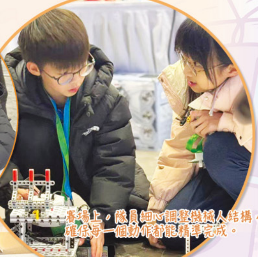
賽場上，隊員細心調整機械人結構，確保每一個動作都能精準完成。