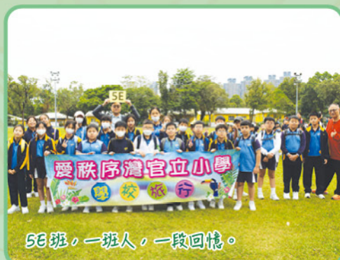
5E班，一班人，一段回憶。