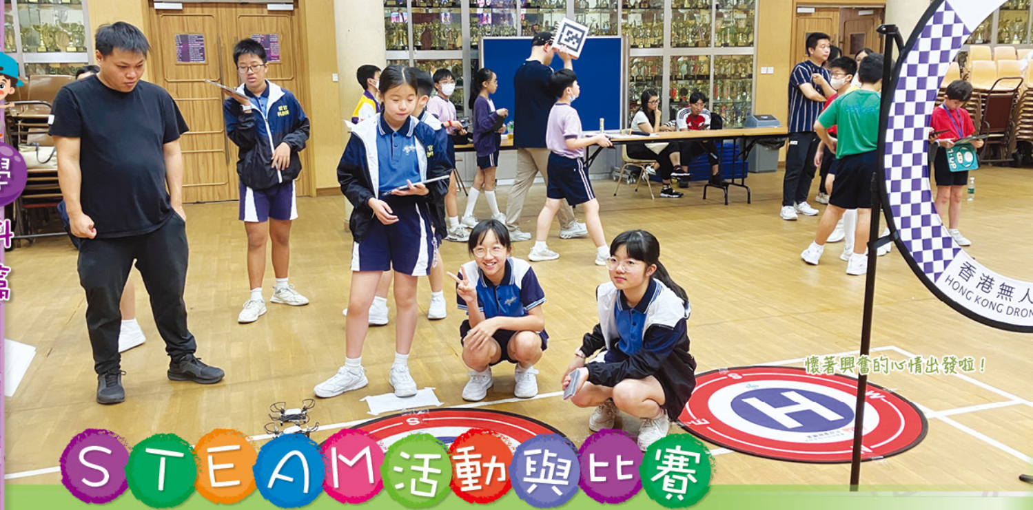
懷著興奮的心情出發啦！