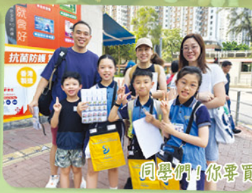
同學們！你要買一枝旗嗎？