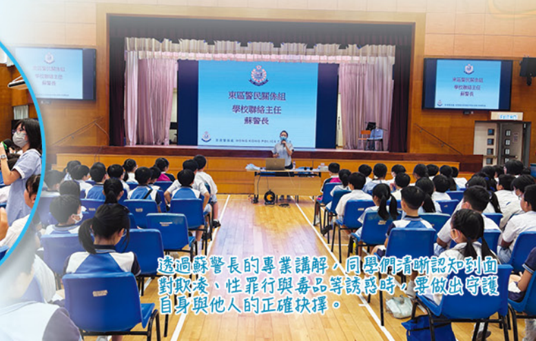
透過蘇警長的專業講解，同學們清晰認知到面對欺凌、性罪行與毒品等誘惑時，要做出守護自身與他人的正確抉擇。