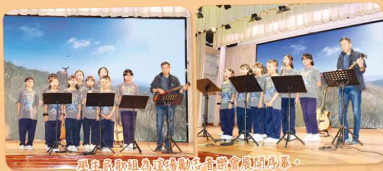
學生民歌組為這場勵志音樂會展開序幕。