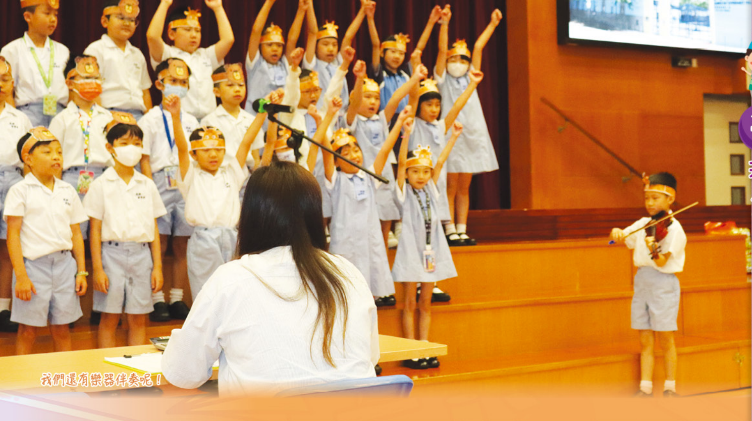
我們還有樂器伴奏呢！