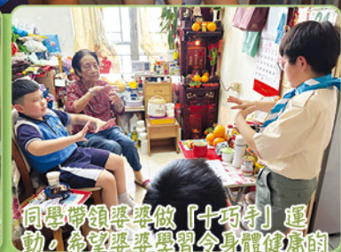
同學帶領婆婆做「十巧手」運動，希望婆婆學習令身體健康的小方法。