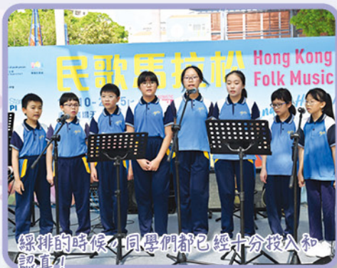
練排的時候，同學們都已經十分投入和認真！