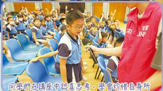
同學們在講座中認真思考，學會珍惜自身所擁有的生活與資源。

為配合校本輔導活動，培養學生正向價值觀，學校於二零二五年十月十五日（星期三）為小一至小三同學舉辦了以貧窮與關愛為主題的講座，讓同學了解貧困人士的生活困境，明白及珍惜自身所擁有的東西。這次講座也引導同學以善意關懷他人、主動傳遞溫暖，讓同學們學會珍惜生活、實踐關愛他人的重要意義。