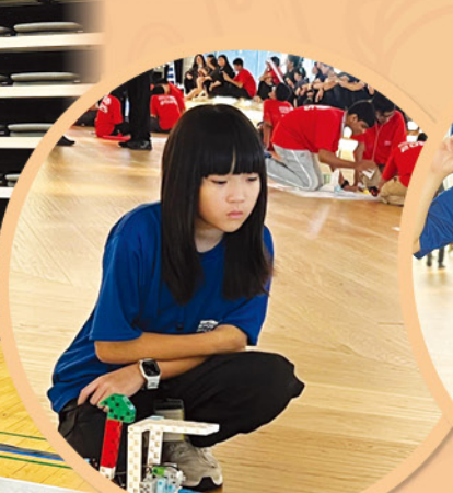
隊員全神貫注地觀測機械人的結構調整與佈局。