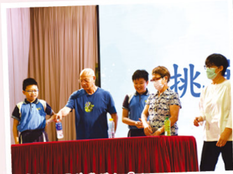
大家都玩得非常投入呢!

為讓學生服務區內長者，發揮關愛感恩、樂於服務的精神，同時增加長幼溝通的機會，推廣跨代共融的訊息，學校於二零二五年六月十六日（星期一）及六月十七日（星期二）舉辦「歡樂在愛官」老幼派對。六月十六日，本校邀請了學生的祖父母到校，六月十七日則邀請了東華三院方樹泉長者地區的長者到校觀賞學生精心準備的表演及遊戲，共100名長者參與活動。學生積極策劃及籌備服務內容，如構思遊戲、準備才藝表演等，讓長者於活動中盡興及感受到被關懷。