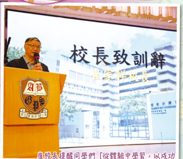
崔校長提醒同學們「從體驗中學習，以成功創造成功」的理念。