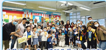
首節課堂，義工導師及學生透過遊戲互相認識！

本年度繼續與香港仔坊會尚融坊林基業中心合辦「童學輕鬆天地課後支援服務」，由義工導師協助指導學生，以一對一的形式進行功課輔導，義工導師亦會因應學生的學習進度及情況協助學生溫習課本，以培養學生的責任感、善良品格及自律性。