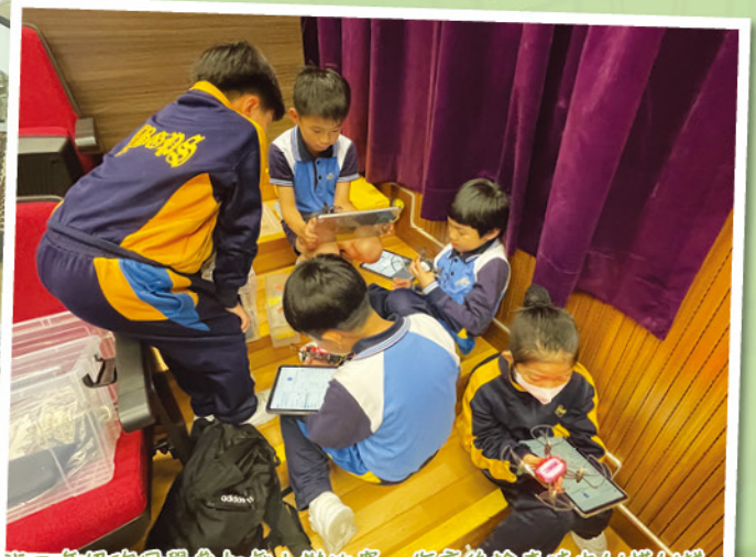
一班三年級的同学參加無人機比賽，作高後檢查時也似模似樣。