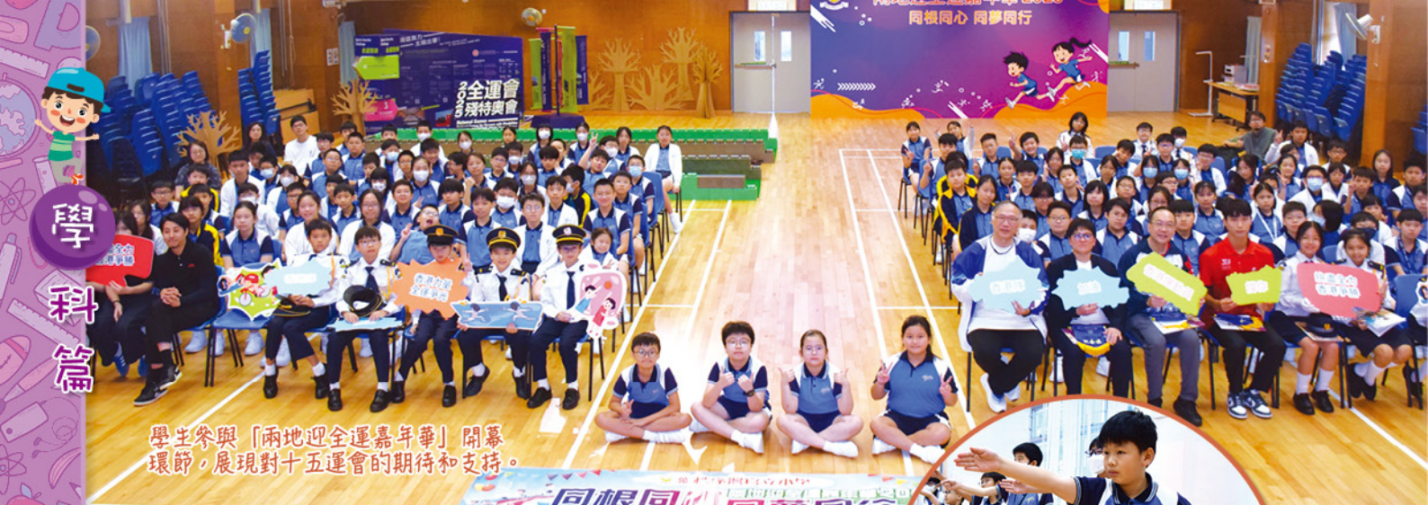
學生參與「兩地迎全運嘉年華」開幕環節，展現對十五運會的期待和支持。