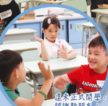
還未正式開學，同學們已認識新朋友！