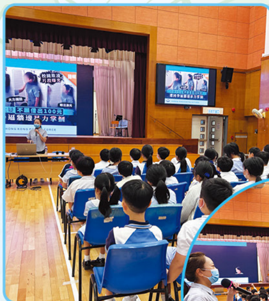
你看，大家都專心聆聽呢！

二零二五年十月二十日（星期一），學校為高年級同學舉辦了一個關於「反欺凌、防性罪行、拒毒品」的講座，讓同學認清欺凌、性罪行與毒品的禍害，建立自我保護的意識。此外，同學們更學懂遠離不良行為、守護自身安全的重要性。