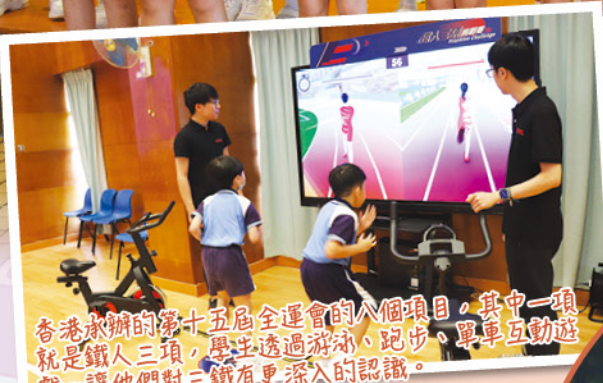
香港承辦的第十五屆全運會的八個項目，其中一項就是鐵人三項，學生透過游泳、跑步、單車互動遊戲，讓他們對三鐵有更深入的認識。