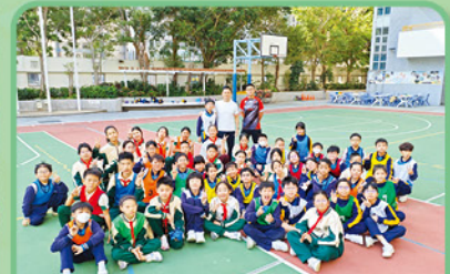
金澤小學的同學參與體育課的活動。