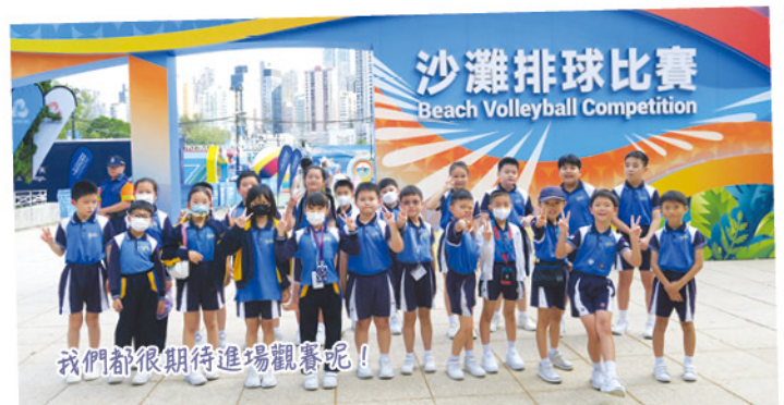
我們都很期待進場觀賽呢！