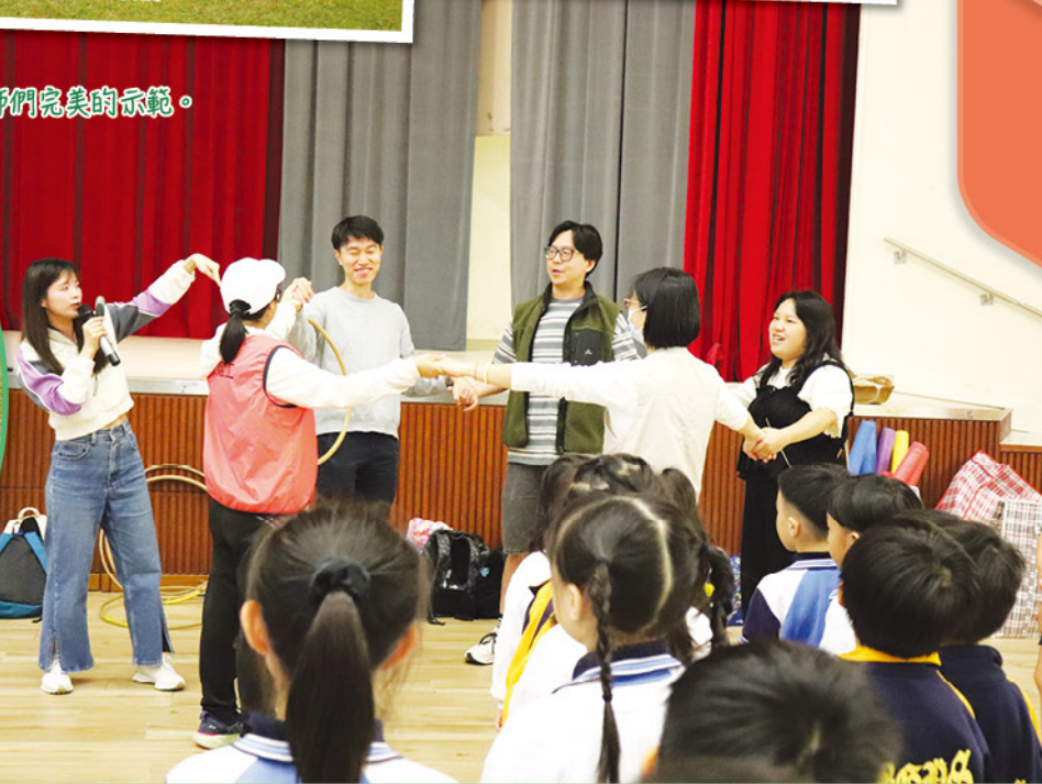
老師們完美的示範。