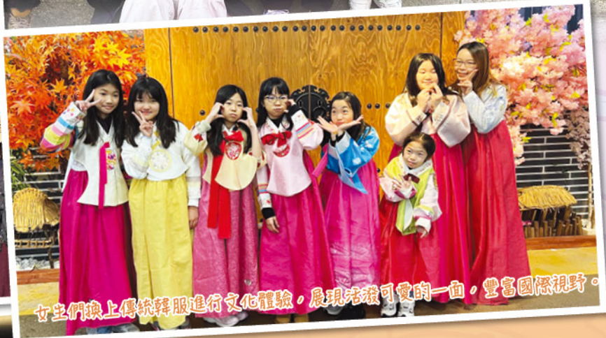
女生們換上傳統韓服進行文化體驗，展現活潑可愛的一面，豐富國際視野。