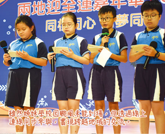
雖然姊妹學校因颶風未能到場，但透過線上連線同步參與，實現跨越地域的交流。