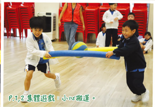
P.1,2 集體遊戲：小心搬運。