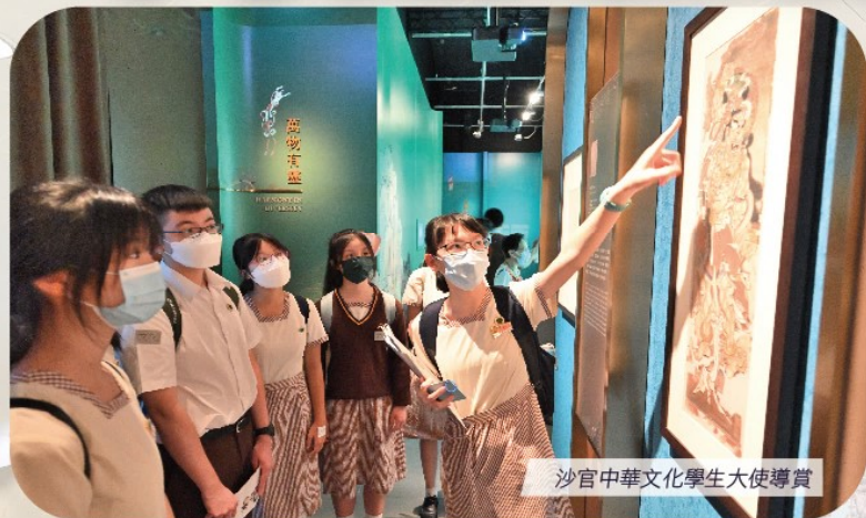
沙官中華文化學生大使導賞

沙田官立中學國家安全教育組和國民教育組配合香港文化博物館「敦煌——千載情緣的故事」展覽，以「沙官敦煌文化之旅」為主題，活用社區資源，設計跨課程學習的學與教活動，讓學生走出校園，親身進入社區體驗學習，藉此提高學生對中華文化的認識，加強國民身份認同，了解文化傳承的責任。