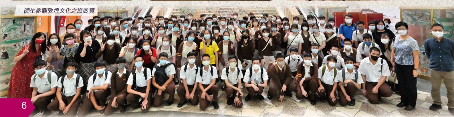
師生參觀敦煌文化之旅展覽