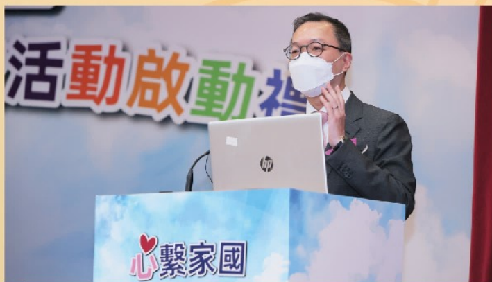
律政司司長林定國資深大律師主講 在「一國兩制」下如何深化青少年的守法精神

首個活動為「心繫家國」國慶慶祝暨官校聯校活動啟動禮，於去年9月23日在官立嘉道理爵士中學（西九龍）舉行。啟動禮由律政司司長林定國資深大律師、律政司副司長張國鈞先生、教育局局長蔡若蓮博士及教育局常任秘書長李美嫦女士主禮。當日活動包括升國旗禮、局長致辭、主題演講及分享、聯校國民教育活動簡介及播放國慶活動的錄影精華片段。林定國司長擔任主講嘉賓，與教育界同工分享在「一國兩制」下如何深化青少年的守法精神。約160位教育局人員、官立學校校長和副校長，以及中小學學校議會、校長會和辦學團體的代表參與啟動禮。