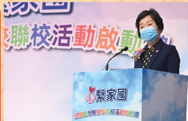
教育局局長蔡若蓮博士致辭