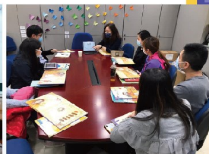
透過行動研究實踐數學繪本教學