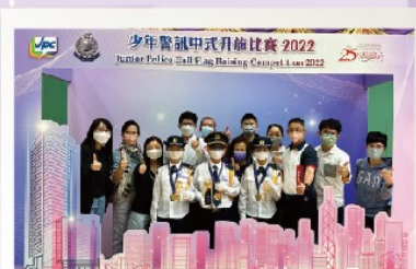
北角官立小學(雲景道)老師、 家長和學生一同分享獲獎的喜悅