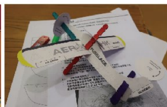
透過製作三軸模型，學生了解飛機的三個運動主軸，以及哪一個位置控制飛機的運動。