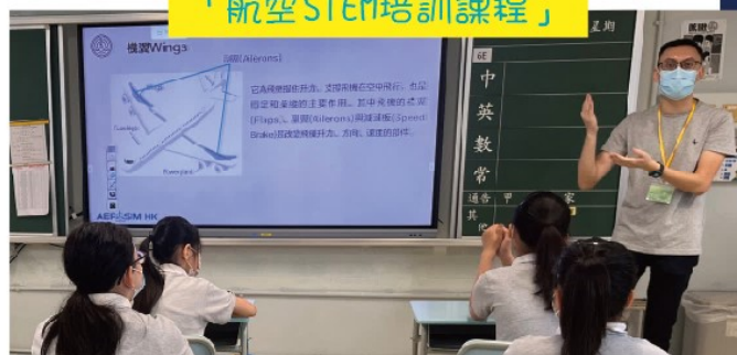
同學們正在認真地學習飛機的結構。