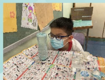
製作靜觀瓶(軒尼詩道官立小學)