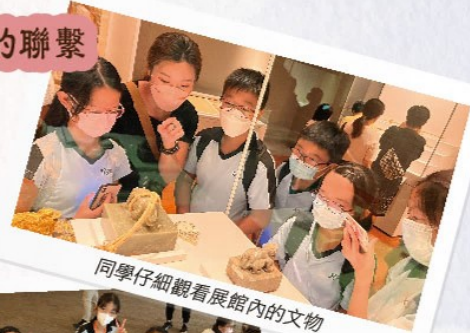
同學仔細觀看展館內的文物