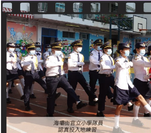
海壩街官立小學隊員 認真投入地練習