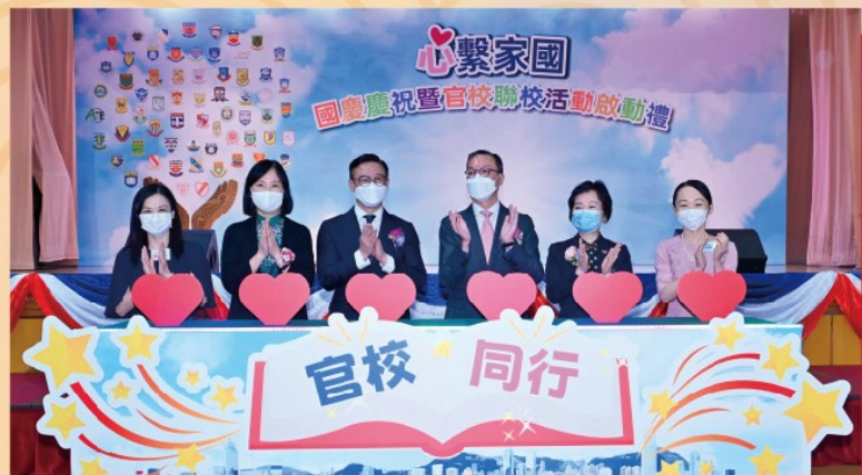
主禮嘉賓主持啟動禮儀式

65所官立學校率先響應教育局於去年8月發布的「國民教育一活動規劃年曆」，以「心繫家國」為主題，於2022/23學年舉辦一系列的聯校國民教育活動，透過全校參與和聯校協作模式，加深學生對中華文化、中國歷史和國家發展的認識，培養他們的國家觀念、國民身份認同和愛家愛國的情懷。本學年「心繫家國」聯校活動系列共有11項國民教育活動，內容豐富和多元化。