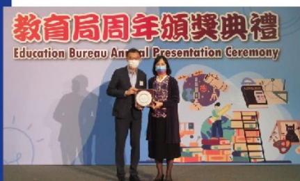
左起：前教育局首席助理秘書長 (教育統籌委員會及策劃)容寶樹先生、 教育局常任秘書長李美嫦女士

典禮最後一個環節是由常任秘書長向服務年資達35年或以上的榮休同事頒發退休紀念銀碟。當中榮休副校長趙鳳珠女士更透過短片與來賓分享多年來的工作經歷和難忘回憶。是次頒獎典禮在一片歡樂氣氛中圓滿結束。