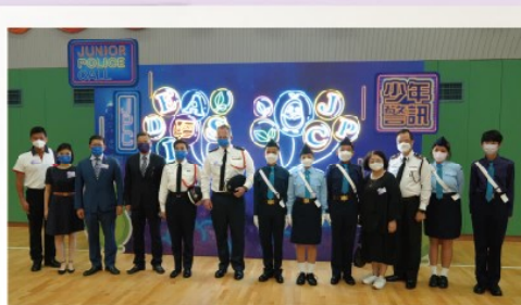
賽馬會官立中學代表警務處西九龍總區參賽

官立學校隊伍參與是次比賽，賽前積極進行步操及升旗儀式訓練，成績有目共睹。透過是次比賽，培養學生正面的價值觀及國家觀念，並提升國民身份認同。