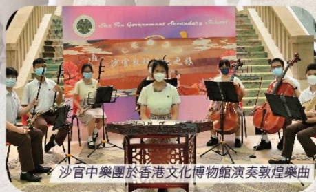
沙官中樂團於香港文化博物館演奏敦煌樂曲

「沙官敦煌文化之旅」跨課程學習活動，能讓學生更深入認識敦煌藝術，引導學生發掘並欣賞這曼妙生姿的文化瑰寶，窺探珍貴的中華歷史文物，並培養學生的國家意識以及作為中華民族一份子的認同感。