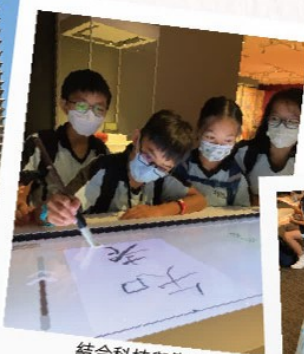
結合科技與傳統， 在電子屏幕上臨摹