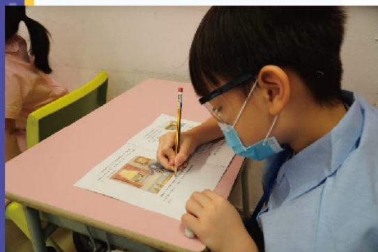
同學正認真地在繪本小冊子上找出單數

本校就數學繪本教學的教研成果及教學心得，曾在不同的教育刊物中分享，期望除了學生能從計劃中得益外，教師亦能從中成長。