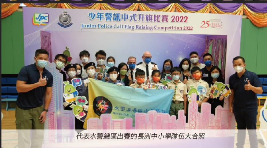
代表水警總區出賽的長洲中小學隊伍大合照