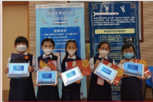
學生積極參與網上遊戲