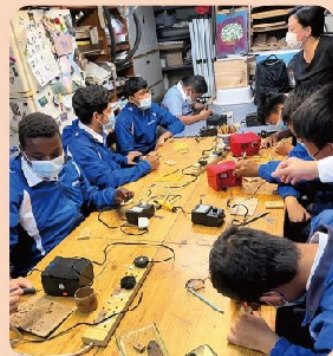
非華語學生到「牛棚工作室」製作烙畫

11月11日，兩校的非華語學生一同到土瓜灣區考察，由中文大學伍宜孫學院「聲昔再現」義工帶領三十多位非華語學生，參觀土瓜灣區著名地標海心公園、十三街及牛棚藝術村，從中探討「新舊交替」及「土地用途」課題。