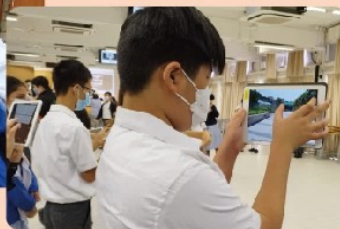
同學們對學習非常投入

11月14日，官立嘉道理爵士中學(西九龍)的非華語學生到賽馬會官立中學，運用中文大學EduVenture「觸境生情」VR教材，帶領賽官中一級學生進行「VR虛擬實景課堂」，學生不需親身到訪南區，他們透過平板電腦，遊覽了南區著名地標包括美利樓、赤柱大街及赤柱海傍，從中探討中華文化和「新舊交替」課題。