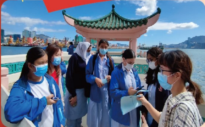
由中文大學伍宜孫學院「聲昔再現」義工帶領三十多位非華語學生，參觀土瓜灣區著名地標「海心公園」