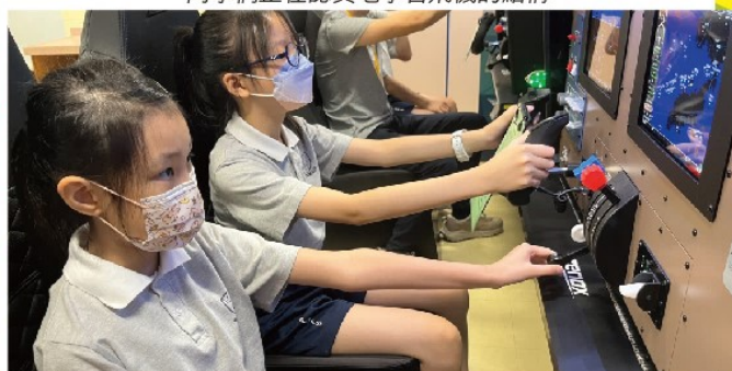
同學們二人一組，以正副機師的身份接受訓練，從而培養團隊精神。