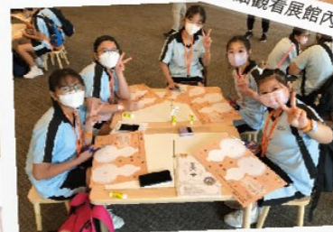
同學們在博物館動手做手工， 設計瓷器圖樣