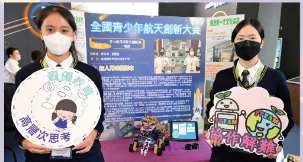
宣道會陳朱素華紀念中學於「月球探索創新賽」高中組獲得一等獎。專案設計概念是一款無人月球探測車，於月球上執行長期和短期的貢獻任務。