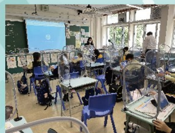
Technology enhanced interaction in classrooms (Tong Mei Road Government Primary School)