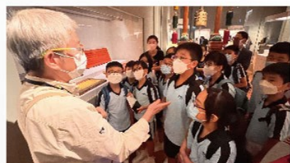
同學細心聆聽導賞員的講解

帶著學習任務前往參觀香港故宮文化博物館，不僅讓學生發掘珍貴文物背後精彩故事及其蘊含的文化意義，追溯中外文化交流的軌跡，還可以思考古物與現今生活及個人之間的聯繫，探索傳承與創新的關係。