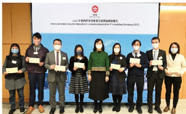
教育局常任秘書長李美嫦女士與來自策劃，基建及學位分配科，以及學校發展及行政科得獎者合照。

另外，教育局每年均頒發常任秘書長嘉獎信，以表揚工作表現優秀、對提升部門工作效率或形象有重大貢獻，以及在其他方面表現卓越的同事。2022年教育局常任秘書長嘉獎信頒發儀式已分別於2023年1月4、5及10日順利舉行。常任秘書長李美嫦女士親臨主禮，向工作表現優秀或在防疫抗疫方面有突出表現的員工頒發嘉獎信。