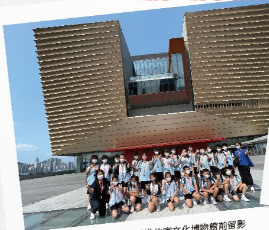
師生於香港故宮文化博物館前留影