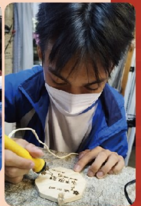
菲律賓學生用中文刻「永不放棄」