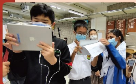
非華語學生運用VR教材，帶領其他學生進行VR虛擬實景課堂