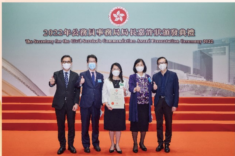
左起：首席行政主任(行政)陳志鵬先生、教育局副秘書長(三)杜永恆先生、得獎者梁路得女士、教育局常任秘書長李美嫦女士及首席助理秘書長(行政)鄭偉文先生。