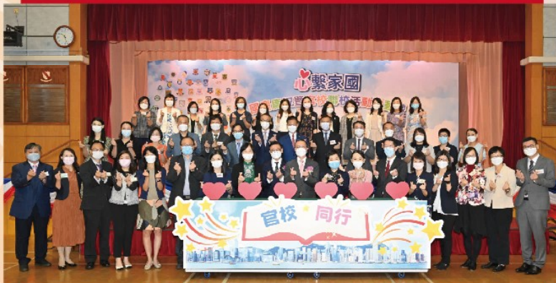
主禮嘉賓與教育局人員及官立中學校長拍照留念