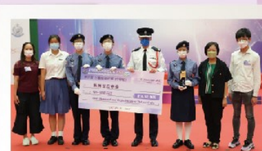
長洲官立中學榮獲 警務處水警總區冠軍