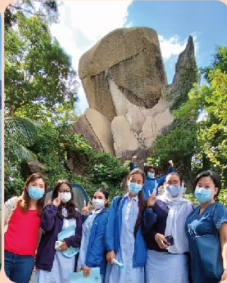
師生在海心公園的魚尾石前合照