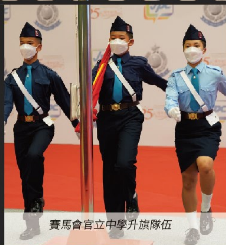
賽馬會官立中學升旗隊伍