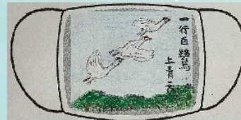
學生配合詩句意境繪圖，設計口罩圖案(荃灣官立小學)