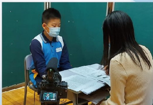
模擬面試都是生涯規劃不能缺少的元素

愛官深信生涯規劃教育是一項持續及終身的學習，以成長課、多元活動、專家教導、升中輔導等平台，從「生命分享」、「事業探索」和「升學規劃及管理」三個維度開展生涯規劃教育，冀望學生在品行、道德、正面態度和適應力各方面都得到提升。