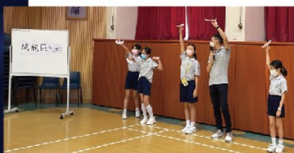
學生在不同場地進行試飛。