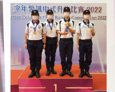
觀塘功樂官立中學榮獲 警務處東九龍總區冠軍