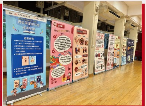
「國家教育展覽：遊走展覽與科技·探索知識」活動現場