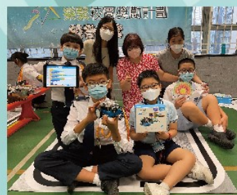
師生展示學習成果(李陞小學)

過去一年，本組為官小教師創設跨校交流的機會，至今參與跨校交流活動的教師已超過200人，可見同工積極求進的專業態度。如欲進一步了解本組與教師的合作成果，請瀏覽此網址： http://www.edb.gov.hk/sbss/sbcdp