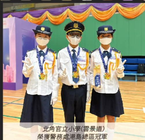
北角官立小學(雲景道) 榮獲警務處港島總區冠軍