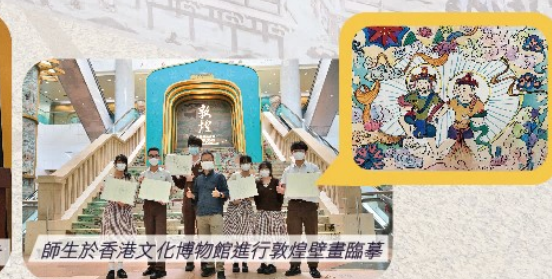
師生於香港文化博物館進行敦煌壁畫臨摹