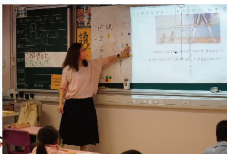
老師正在利用繪本故事教授單數和雙數