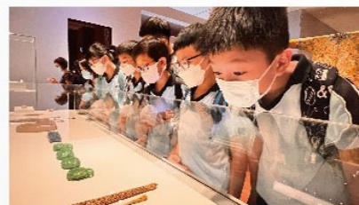
同學聚精會神欣賞展品

衷心感謝國家對香港特區的厚愛，使我們有機會在香港欣賞到難得一見的中國歷史文物！館內展出的文物琳琅滿目，令人目不暇給。身為中國人，我不禁為國家優良的傳統文化和藝術引以為傲。經過這次的參觀，令我明白到保存國家歷史文物的重要，使文化和藝術得以世代相傳，發揚光大。我期待日後能有機會觀賞更多中國歷史文物，進一步探索中國歷史和文化的精萃。