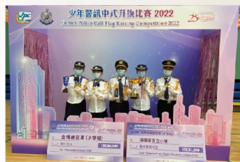
海壩街官立小學努力的成果，一齊分享吧！