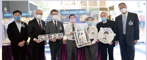
喬色園主辦可銘學校於「北斗創造美好生活創意比賽」小學組獲得一等獎。當行山人士不幸遇到意外時，可利用背包內設的北斗定位系統，以無線電發出求救訊號。