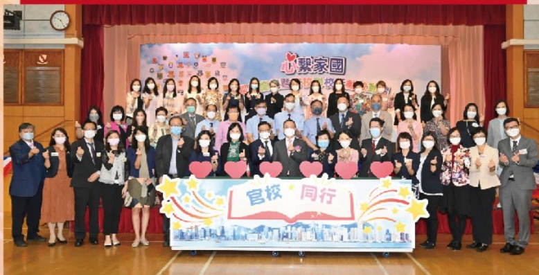
主禮嘉賓與教育局人員及官立小學校長拍照留念