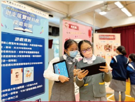
學生透過擴增實境活動，寓科技遊戲於學習國家發展