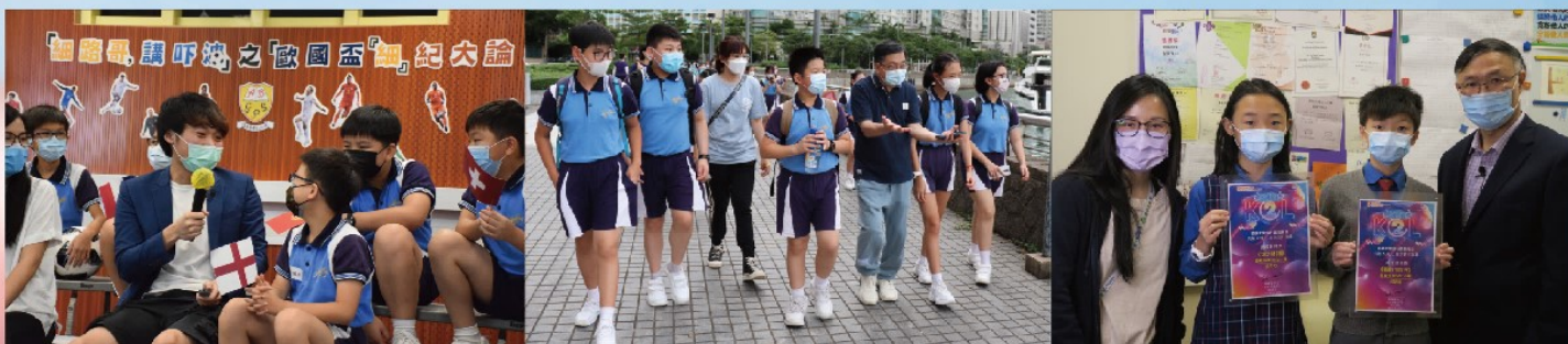
同學們由專業導師悉心教導，體驗不同工作，感到十分新奇

從小學開始推動生涯規劃教育，能讓學生及早學習規劃人生。愛官以「從體驗中學習，以成功創造成功」的理念，為學生提供豐富多樣的課外活動及培訓，協助他們認識自我，發掘長處及能力。學校邀請多個行業的精英，例如運動員、歌手、音樂家、藝術家、金牌司儀、KOL、生態導賞員等，為學生擔任專業導師，培養學生的終生興趣。