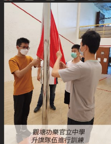
觀塘功樂官立中學 升旗隊伍進行訓練