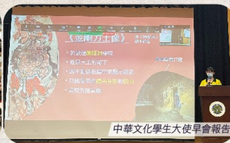
中華文化學生大使早會報告